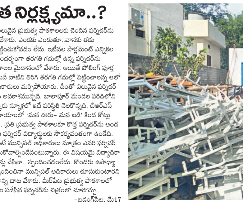
-బడగంపేట, మే 17

టుమాలో అంతే ఆయన ప్రసంగించారు. ప్రతి రోజూ మెట్రో సేవలను 4.5 లక్షల మంది ప్రయాణికులు వినియోగించుకుంటున్నారని, నగలు ట్రేఫ్ పాడవు 12.5 కోట్లమీటర్లు అని వివరించారు. నగరవాసుల నుంచి వచ్చిన విజ్ఞానం దుష్ప్రవృత్తి మెట్రో సమయాన్ని మరో 45 నిమిషాల పాటు పొడిగించినట్లు వెల్లడించారు. కాగా, ఈ మెట్రో రైల్ ఎల్ అండ్ టీ బీఐ ట్రాబిజీ సాధారణంగానే ఉదయం 6 నుంచే సర్వీసులు నడుస్తాయి. పొడిగించిన వేళలు