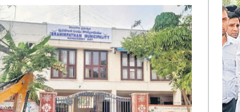
ఇబ్రహీంపట్నం మున్సిపల్ కార్యాలయం