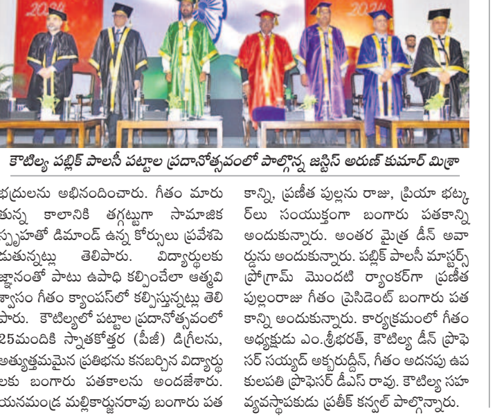
కాలిల్లో పబ్లిక్ పాలసీ పట్టాల ప్రధానేత్యవంతు పాల్గొన్న జస్టిస్ అరుణ్ కుమార్ మిశ్రా