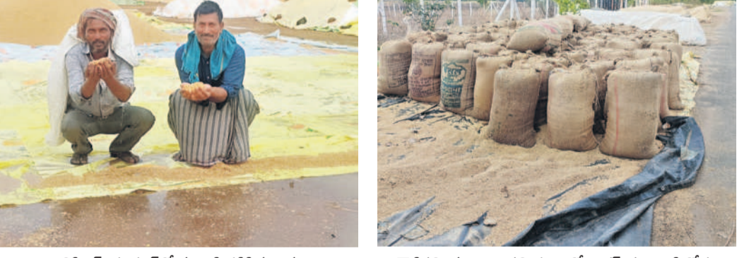
లిలిపిచెడ: చందూర్లో వర్షానికి తడిసిన ధాన్యం చూపుతున్న రైతులు