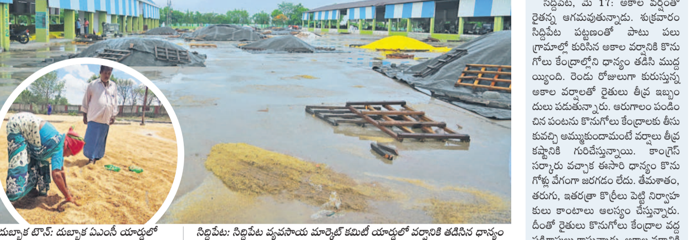
దుబ్బాక టౌన్: దుబ్బాక ఏఎస్ యార్డులో | సిద్దిపేట: సిద్దిపేట వ్యవసాయ మార్కెట్ కమిటీ యార్డులో వర్షానికి తడిసిన ధాన్యం

ధాన్యం కొనుగోళ్లలో తీవ్ర జాప్యం.. అకాల వర్షాలకు తడుస్తున్న ధాన్యం