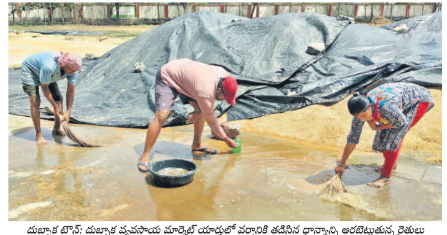
దుబ్బాక టౌన్: దుబ్బాక వ్యవసాయ మార్కెట్ యార్డులో వర్షానికి తడిసిన ధాన్యాన్ని అరబెట్టుతున్న రైతులు