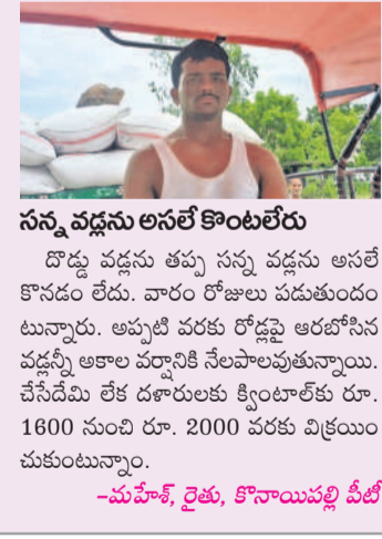
సన్న వడ్లను అసలే కొంటలేరు

మనోహరాబాద్, మే 17: కాంగ్రెస్ పాలనలో రైతులకు తీవ్రమైన తప్పుడం లేదు. దొడ్డు వడ్ల, సన్న వడ్ల పండించిన రైతులను ధాన్యాన్ని విక్రయించేందుకు కొనుగోలు కేంద్రాల వద్ద పడిపోతున్నామని అన్నారు. బోనస్ డేవుడెరుగు కనీసం పండించిన ధాన్యాన్ని కొనేందుకు ప్రభుత్వం ముందుకు రావడం లేదని రైతులు ఆవేదన వ్యక్తం చేస్తున్నారు. అధిక డిమాండ్ ఉన్న సన్న వడ్లకు సైతం కష్టం కావడం దాఖలైంది. కొనుగోలు కేంద్రాల్లో సన్న వడ్లకు అసలే కొనుగోలు చేయకపోవడంతో రైతులు దిక్కుతోవని స్థితిలో పడిపోయారు. అకాల వర్షాలకు ఎక్కడ నష్టపోతామన్న భయంతో తక్కువ