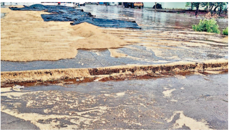
ఎగపోస్తూనే ఉన్నది. గుండె నిబ్బరం తాలూకు వగ పోక అది.