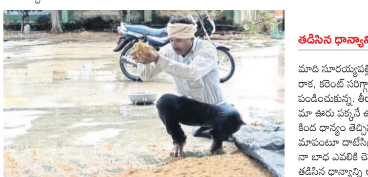
తడిసిన ధాన్యాన్ని కొనాలి..

వేములవాడ రూరల్ మండలంలోని అనువురం రైతులు రోడ్లెక్కారు. వేములవాడ - కరీంనగర్ రహదారి పై బైరాయింది ధర్మా చేశారు. గ్రామంలోని కొనుగోలు కేంద్రానికి ధాన్యం తెచ్చి రోజులు గడుస్తున్నా కొనడం లేదని, ఇంకా లారీలు రాకపోవడంతో బస్తాలు పేరుకుపోయి వర్షానికి తడుస్తున్నాయని వాపోయారు. ఎన్నిసార్లు అధికారులకు విన్నవించినా పట్టించుకోవడం లేదని మండిపడ్డారు. ధర్మా విషయం తెలుసుకోని సీబి వీరప్రసాద్ అక్కడికి చేరుకోని రైతులతో మాట్లాడి ధర్మాను విరమించజేశారు. అలాగే కొనుగోలు కేంద్రాన్ని డి.పి. సందర్భించి బస్తాను తరలిస్తామని హామీ ఇచ్చారు.