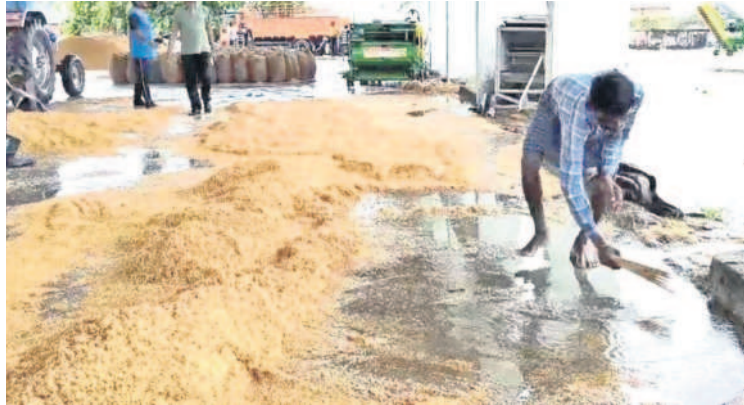
మంధని: కొనుగోలు కేంద్రంలో వర్షానికి తడిసిన ధాన్యం కుప్పలో నుంచి వరద నీటిని బీజులు తీసివేసే పనులు చేస్తున్న రైతు