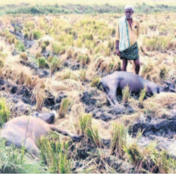
మంధని రూరల్: ఖానాపూర్లో విద్యుత్ షాక్తో మృతి చెందిన గేదెలు

మంధని/మంధని రూరల్/వేముల వాడ/కోల్పోనీటి/రుద్రంగి/మే 17: ఉమ్మడిజిల్లాలో గురువారం బీజులకు సృష్టించిన గాలివాన, శుక్రవారం కూడా అక్కడక్కడ ముంచెత్తినది. ప్రధానంగా మంధని, రామగుండ్లం, వేములవాడ, తిమ్మాపూర్ మండలం సున్నాపూర్లో దంచికొట్టింది. మధ్యాహ్నం తర్వాతి నుంచే పడుతూ.. రైతన్నకు తీరని వేద సను మిగిల్చింది. కొనుగోలు కేంద్రాల్లోని ధాన్యం తడిసిముద్దయింది. మంధని మండలం ఆరెండ, వెంకటాపూర్, మల్లారం గ్రామాల్లో కోతకొచ్చిన వరి నీల వారింది. మామిడి కాయలు రాలిపో యాయి. ఖానాపూర్లో గాలి దుమారానికి వరి పొలాల్లో ఎల్లీ లైన్ కరెంటు వైపు తెగపడడంతో మేతుల వేగిన అమ్మకుంటే సమ్మయ్యకు చెందిన రెండు బల్బులు కరెంటుపోతే మరణించాయి. గోదావరిఖనిలో వర్షం దంచి కొట్టడంతో జనజీవనం స్తంభిల్చింది. వేములవాడలో 2.5 సెంటీమీటర్ల వర్షపాతం నమోదైంది. రోడ్డుపై వరదపారడంతో ప్రజలు తీవ్ర ఇబ్బందులుపడ్డారు. రుద్రంగి మండలంలోని పలు కొనుగోలు కేంద్రాల్లో ధాన్యం నీల మునిగింది.