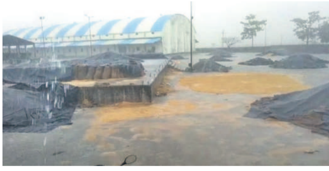
మంధని: మార్కెట్ యార్డులో వర్షంలో తడుస్తున్న ధాన్యం

బోయినపల్లి/ తిమ్మాపూర్ మే 17: బోయినపల్లి మండలంలో గురువారం రాత్రి కడు రుగాలులతో కూడిన వర్షం పడడంతో కరెంటు స్తంభిల్చాయి. కరెంటు తీగలు తెగి పడడంతో విద్యుత్ సరఫరా నిలిచి బీజులు అలుముకున్నాయి. 24 గంటలు దాటినా పునరుద్ధరించకపోవడంతో కొందరుపాక, దేశాయిపల్లిలో అంధకారం నెలకొన్నది. అలాగే కరీంనగర్ జిల్లా తిమ్మాపూర్ మండలం రామకర్ణుల కాలనీలోని 33/11 కే.పి.వి.వి.పల్లి లైన్ స్తంభం వంగడంతో రామకర్ణుల కాలనీ, ఇందిరానగర్ గ్రామాల్లో సైతం కరెంటు సరఫరా నిలిచిపోయింది. పునరుద్ధరణ పనుల్లో జాప్యం జరిగడంతో గురువారం సాయంత్రం నుంచి శుక్రవారం సాయంత్రం వరకు అంతరాయం కలిగింది.