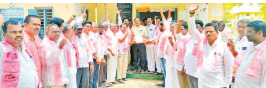
గద్వాల తాసిల్దార్ కార్యాలయం ఎదుట నిరసన చేపట్టిన బీఆర్ఎస్ నాయకులు