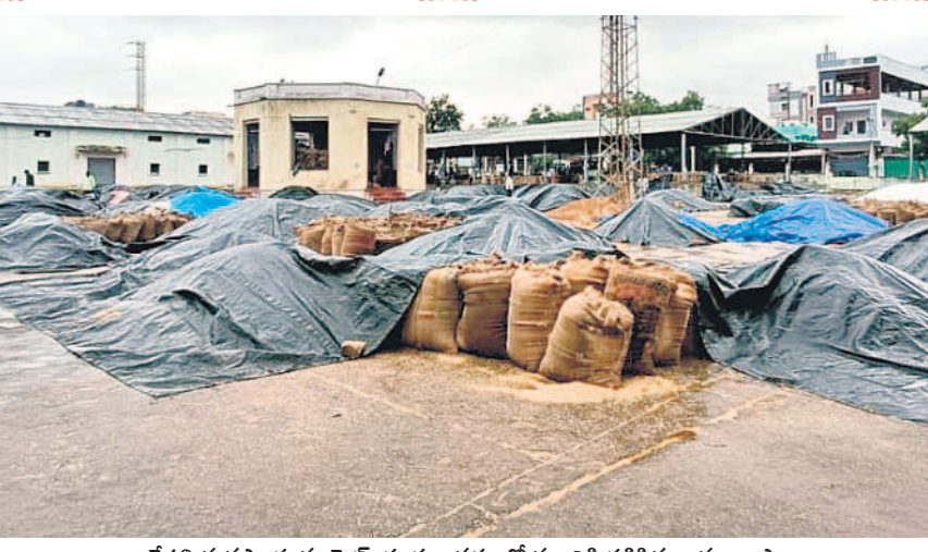
బాడేపల్లి వ్యవసాయ మార్కెట్ యార్డు ఆవరణలో వర్షానికి తడిసిన ధాన్యం బస్తాలు