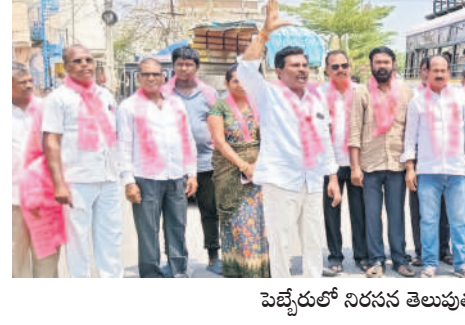
పెట్టేరులో నిరసన తెలుపుతున్న బీఆర్ఎస్ నాయకులు