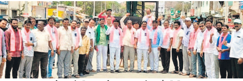
వనపర్తిలోని అంబేద్కర్ చౌరస్తాలో నిరసన వ్యక్తం చేస్తున్న బీఆర్ఎస్ నాయకులు