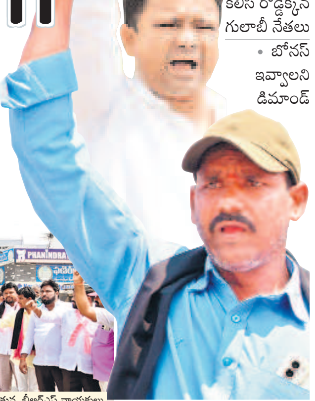
- మహబూబ్ నగర్, మే 16 (నమస్తే తెలంగాణ ప్రతినంది)

కర్షకులకు బోనస్ చెల్లించాలని డిమాండ్ చేశారు. రైతుల సంక్షేమాన్ని విచ్ఛిన్నం చేయాలని హెచ్చరించారు. రైతులపై మరోసారి విషంకక్కిన రేవంత్ పై కన్నెర్ర రూ.500 అదనపు చెల్లింపుపై మాటమార్చు