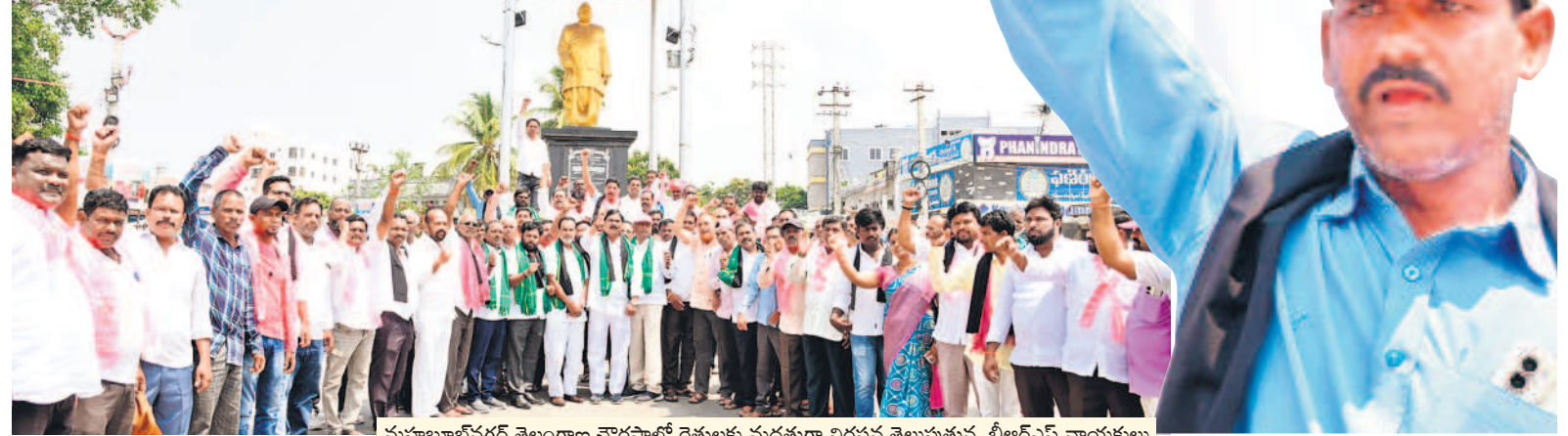
మహబూబ్ నగర్ తెలంగాణ చౌరస్తాలో రైతులకు మద్దతుగా నిరసన తెలుపుతున్న బీఆర్ఎస్ నాయకులు