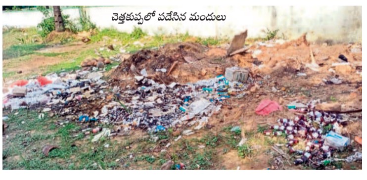
చెత్తకుప్పలో పడేసిన మందులు