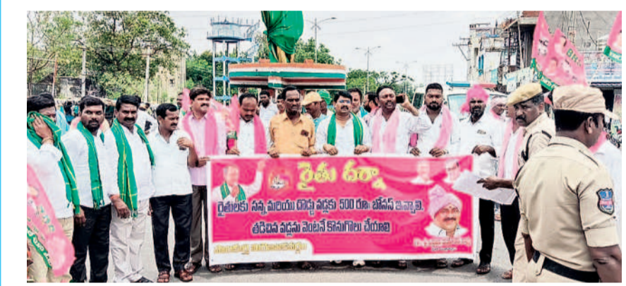
నిరసనలో పాల్గొనేందుకు దేవరపల్లె నుంచి పాలకుల్ కి వెళ్తున్న బీఆర్ఎస్ శ్రేణులు