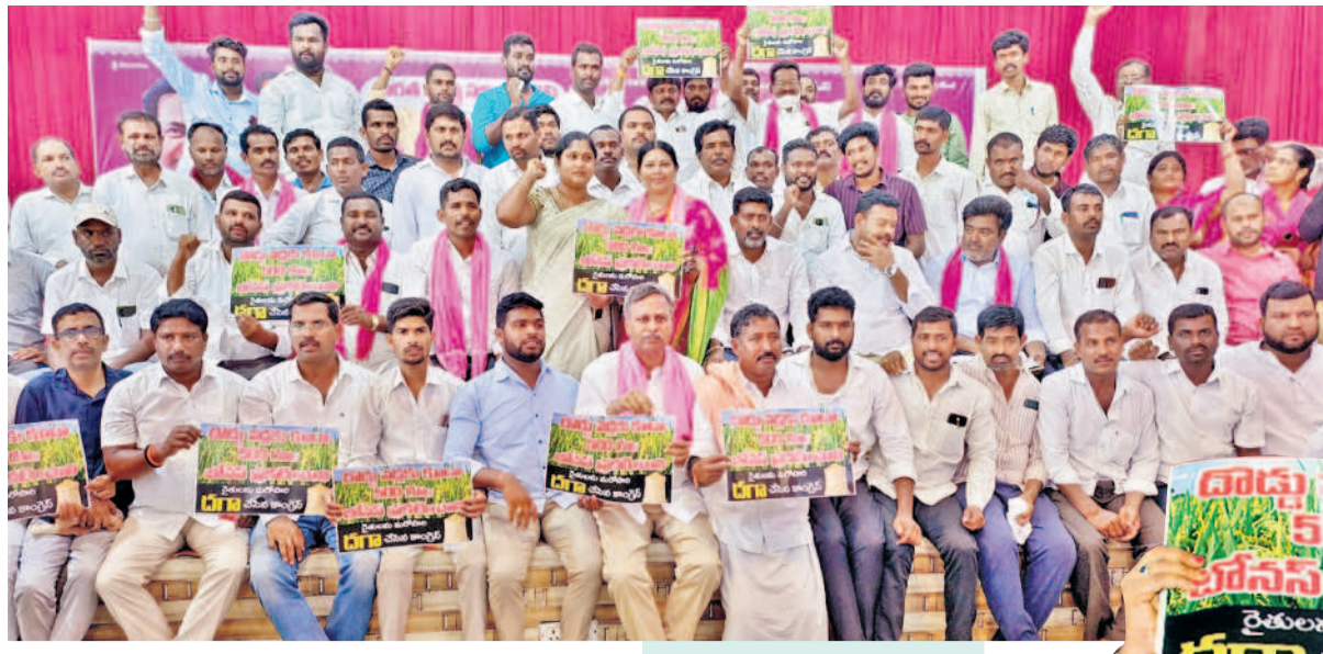
సన్నాల్ తోపాటు దొడ్డు వడ్డకు కూడా 500 చొప్పున రైతులకు కేంద్రాల్లోని ధాన్యం కొనుగోలు కేంద్రాల్లోని ధాన్యం కొనుగోలు దిమాండ్ రైతులకు మద్దతుగా బీఆర్ఎస్ నిరసన అసెంబ్లీ నియోజకవర్గ కేంద్రాల్లో ధర్నాలు వాల్చిన్, పార్టీ ప్రజాప్రతినిధులు, నాయకులు, కార్యకర్తలు