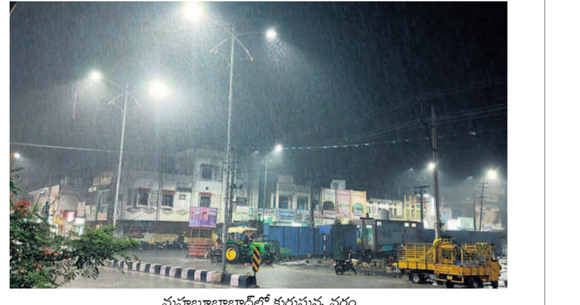
మహబూబాబాద్ లో కురుస్తున్న వర్షం

మోస్తరు వాన పడింది. మహబూబాబాద్ పట్టణంలో భారీ వర్షం కురిసింది. దీంతో కాలనీలోని రోడ్లపైన నీరు నిలిచింది. ఇనవోలు, మడికొండ, కాజీపేట తదితర ప్రాంతాల్లో భారీ వర్షం పడింది. బిల్లియోలో కంట్రోల్ రూమ్ వరంగల్, మే 16: సగం లో కురుస్తున్న భారీ వర్షంతో బిల్లియో అధికారులు అప్రమత్తమయ్యారు. గురువారం రాత్రి నుంచే కంట్రోల్ రూమ్ ఏర్పాటు చేశారు. 24 గంటలు పనిచేసినా సిబ్బందిని నియమిస్తూ కమిషనర్ ఆర్డీని తానా జీ వాకడే ఉత్తర్వులు జారీ చేశారు. 9701999645, 9701999676 నంబర్లకు సమాచారం అందించాలని కోరారు.