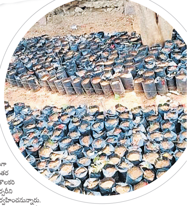
వట్టిచుకోవడంలో ఖాళీగా దర్శనమిస్తున్న బ్యాగులు

కామారెడ్డి, మే 16: రాష్ట్రాన్ని హరితపరచడానికి తీర్చిదిద్దాలనే ఉద్దేశంతో బీఆర్ఎస్ హయాంలో తెలంగాణ తొలి ముఖ్యమంత్రి కేసీఆర్ హరితహారం కార్యక్రమాన్ని ప్రారంభించారు. ప్రతిష్ఠాత్మకంగా చేపట్టిన హరితహారంలో భాగంగా రోడ్లకు ఇరువైపులా, ప్రభుత్వ ఖాళీ స్థలాలు, కార్యాలయాలు తదితర ప్రాంతాల్లో మొక్కలు నాటారు. ప్రతి సంవత్సరం జూన్ నెలలో తొలకరి వర్షాలు కురవగానే మొక్కలు నాటాలనే ఉద్దేశంతో గ్రామానికో నర్సరీని ఏర్పాటు చేశారు. మరో 20రోజుల్లో హరితహారం కార్యక్రమం నిర్వహించనున్నారు. అందులో భాగంగా కామారెడ్డి జిల్లా సదాశివనగర్ మండలంలోని పలు గ్రామాల్లోని నర్సరీల్లో ముందస్తు ప్రణాళికతో మట్టిని తీసుకొచ్చి బ్యాగ్ ఫిల్లింగ్ చేసి విత్తనాలు చేశారు. వేసవి, నర్సరీల నిర్వహణపై అధికారుల పర్యవేక్షణ కరువు విత్తనాలు మొలకెత్తలేదు. మొక్కల సంరక్షణకు తగిన చర్యలు తీసుకోలేదనే ఆరోపణలు వినిపిస్తున్నాయి. పలు గ్రామాల్లో అంతంత మాత్రంగానే విత్తనాలు మొలకెత్తాయి. మిగతా జాగ్రత్త చర్యలు పాటించకపోవడంతో వచ్చిన మొలకలు సైతం ఎండిపోయాయి. అవేన్నూ ప్లాంటింగ్ లో మొక్కలు నాటాలంటే రెండు మీటర్ల పొడవు, అటవీ ప్రాంతాల్లో నాటాల్సిన మొక్కలు రెండు, మూడు ఫీట్ల ఎత్తు ఉండాలని అధికారులు చెబుతున్నారు. ఇప్పటికిప్పుడు కొత్తగా విత్తనాలు వేసినా అవి మొక్కలుగా మారేందుకు రెండు, మూడు నెలల సమయం పడుతుందని పలువురు పేర్కొంటున్నారు. జూన్ చివరి వారం లేదా జూలై మొదటి వారంలో నిర్వహించే హరితహారం కార్యక్రమంపై నీలినీడలు కమ్ముకున్నాయి.