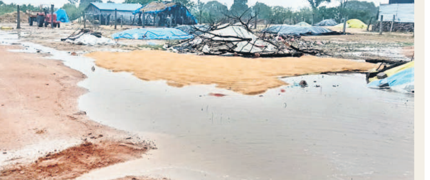
బిక్కనూరు మండలం పెద్దమల్లారెడ్డి గ్రామంలో గురువారం అకాలవర్షానికి తడిసిన ధాన్యం

ఖల్తీవాడి/ బిక్కనూర్, మే 16: ఉమ్మడి నిజామాబాద్ జిల్లాలో గురువారం మోస్తరు వర్షం కురిసింది. కామారెడ్డి జిల్లా బిక్కనూర్, దోమకొండ, నిజామాబాద్ జిల్లా చందూర్, డివేపల్లి తదితర ప్రాంతాల్లో అకాల వర్షం కురిసింది. దీంతో కొనుగోలు కేంద్రాల్లో ఉన్న వడ్లకూపాటు ధాన్యం బస్తాలు తడిసిపోయాయి. నిజామాబాద్ నగరంలో గురువారం రాత్రి గంటపాటు వర్షం కురిసింది. రెండు రోజులుగా అడపాదపా కురుస్తున్న వర్షంతో నగరం చల్లబడింది. గత కొన్నిరోజులుగా అధిక ఉష్ణోగ్రతలతో ఉక్కిరిబిక్కిరి అవుతున్న ప్రజలు.. వర్షం కురవడంతో ఉపశమనం పొందారు.