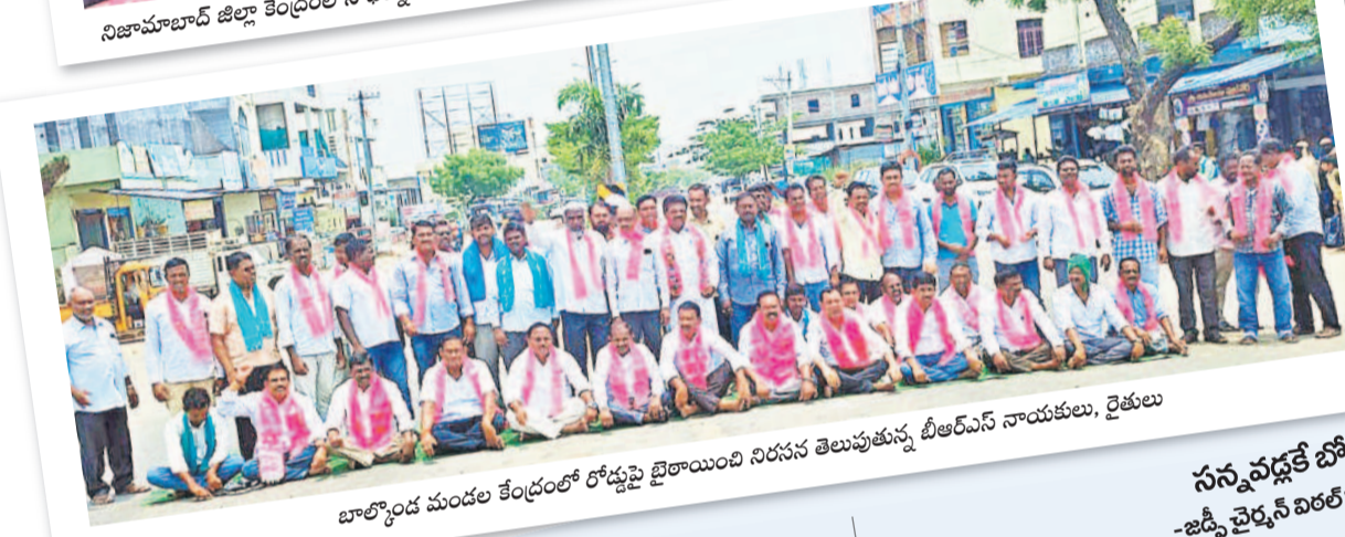
బాలాకృష్ణ మండల కేంద్రంలో రోడ్డుపై బైతాయింది నిరసన తెలుపుతున్న బీఆర్ఎస్ నాయకులు, రైతులు