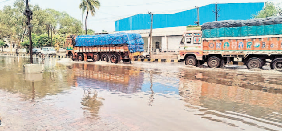
వర్షం నీటితో జలమయమైన మల్కాపూర్-నానారం రోడ్డు