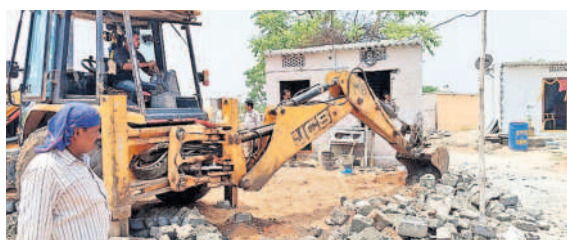
అక్రమ నిర్మాణాలను కూల్చేస్తున్న రెవెన్యూ సిబ్బంది