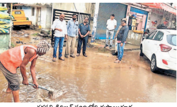
వర్షపల్లి డివిజన్ పరిధిలోని కుషాయిగుడ ప్రధాన రహదారిలో వర్షం నీటిని తోలిస్తున్న సిబ్బంది

మల్కాపూర్: గురువారం సాయంత్రం రెండు గంటల పాటు కురిసిన వర్షానికి మీరపేట్ హెచ్.బీ.కాలనీ డివిజన్ తిరుమలనగర్ లోని ప్రభుత్వ పాఠశాల సమీపంలో చెట్ల ముద్దను ఉన్న విద్యుత్ తీగలు తెగిపోవడంతో కాలనీవాసులు విద్యుత్ అధికారులకు సమాచారం ఇచ్చారు. రెండు గంటల పాటు విద్యుత్ అంతరాయం ఏర్పడడంలో