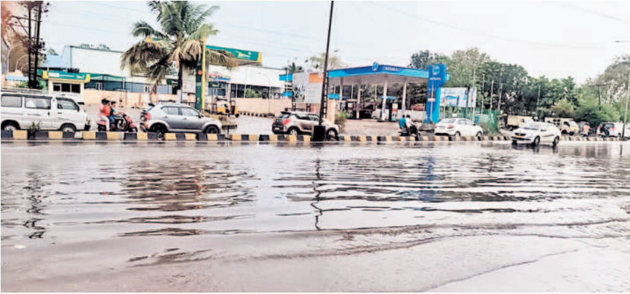
నానారం ప్రధాన రహదారిలో చేలన వరదనీరు