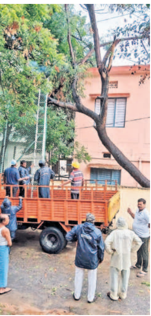
మల్కాపూర్: తిరుమలనగర్ లో తెగిపోయిన విద్యుత్ తీగలను సరి చేస్తున్న విద్యుత్ సిబ్బంది

వెంటనే విద్యుత్ సిబ్బంది మరమ్మత్తులు చేపట్టి సమస్యను పరిష్కరించారు. దీంతో కాలనీవాసులు విద్యుత్ అధికారులకు కృతజ్ఞతలు తెలిపారు. కీరత: మండల పరిధిలోని వివిధ గ్రామాల్లో ఉరుములు, మొరుపులతో కూడిన భారీ వర్షం అధికారులు కంప్యూటర్ తీసివేయడంతో ప్రజలు నానా ఇబ్బందులు పడ్డారు. ఇంకా రైతులు కోసిన దాస్యం చాలా వరకు కల్పాలనే ఉండిపోవడంతో రైతులు అందోళ్లను గుర్రుతున్నారు. దాస్యం ప్రభుత్వం కొనసాగించడంతో రైతుల పరిస్థితి మరి దారుణంగా మారింది.