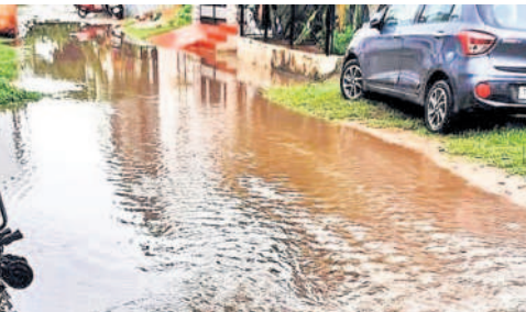
వర్షపల్లి డివిజన్ పరిధిలోని కృష్ణారెడ్డినగర్ లో రోడ్డు ప్రవహిస్తున్న వర్షం నీరు