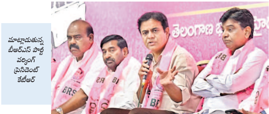
మాట్లాడుతున్న బీఆర్ఎస్ పార్టీ వర్గం ప్రెసిడెంట్ కేటీఆర్