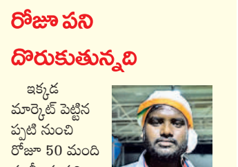
రోజూ పని దారుకుతున్నది

బుక్ చేస్తారు. వాహనం చేరుకున్నది మొదలు దాని కాయ ధర, పేమెంట్ వివరాలను ఎప్పుడో టిక్కెట్ల రైతు పోస్ట్ సమాచారం అందిస్తారు. నలుగురు ఐఐటీ విద్యార్థులు కలిసి నెలకొల్పిన ఈ ప్రొటెక్ట్ సంస్థ కేవలం మామిడి కాయలే కాకుండా ఇతర పండ్లను కూడా సేకరించి డిమాండ్ గా డిమాండ్ ఉన్న రాష్ట్రాలకు ఎగుమతి చేస్తారు. ప్రస్తుతం ఎల్లూర్లలో ఏర్పాటుచేసిన మార్కెట్ ద్వారా మధ్యప్రదేశ్, ఢిల్లీ, రాజస్థాన్, హర్యానా, ఉత్తరప్రదేశ్, మహారాష్ట్రకు మామిడి కాయలను నిన్ను మొన్నటివరకు వరంగల్ మార్కెట్లో మామిడికి తక్కువ ధర ఉండగా, ఈ ప్రొటెక్ట్ మార్కెట్ ఏర్పాటైన తర్వాత భారీగా పెరిగిందని రైతులు సంతోషంగా చెబుతున్నారు.