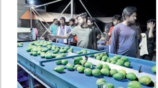
మిషన్ ద్వారా గ్రేడింగ్

రైతుల మేలు కోసమే రైతులకు మేలు చేయాలన్నదే మా కంపెనీ లక్ష్యం. అందుబాటులో మార్కెట్లను ఏర్పాటు చేసి మామిడి కాయలను సేకరించి వినియోగదారులకు కూడా కోతలు పూర్తయిన తర్వాత సమయంలో తాజాగా అందిస్తున్నాం. క్రయవిక్రయాలు అయిపోయిన తర్వాత గంటల్లోనే రైతుల బ్యాంకు ఖాతాల్లో డబ్బు జమవుతుంది. మార్కెట్ ను విస్తరించేందుకు ప్రయత్నాలు చేస్తున్నాం.