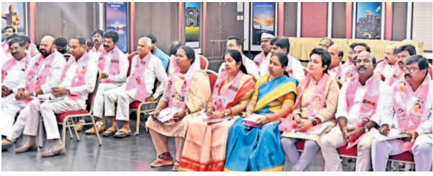
ఎమ్మెల్సీ సమాహార సమావేశానికి హాజరైన ఉమ్మడి జిల్లా బీఆర్ఎస్ ప్రజాప్రతినిధులు, నాయకులు