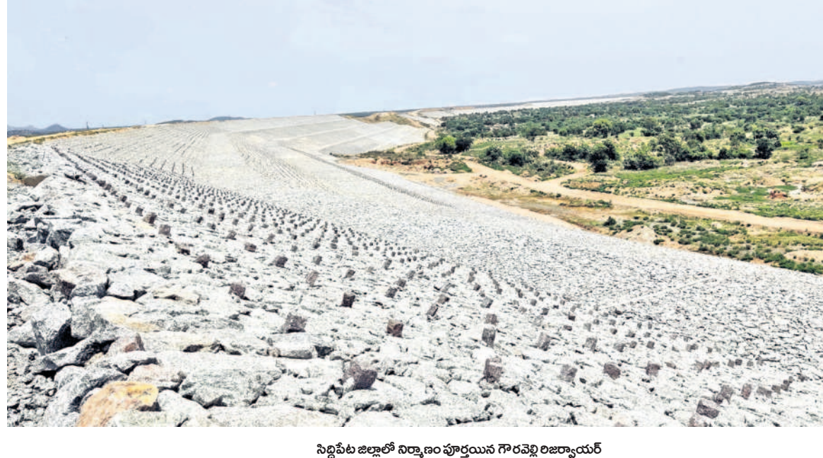
సిద్దిపేట జిల్లాలో నిర్మాణం పూర్తయిన గౌరవెలి రిజర్వాయర్