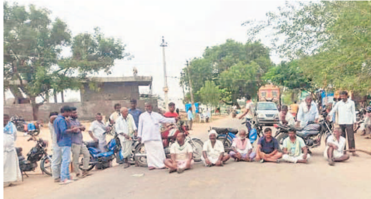
చిలిపిచెడ: చిట్టూల్లో మెడక-నంగారెడ్డి రహదారిపై తూకం వేసిన ధాన్యం బస్తాలు తరలించాలని రాస్తాకోకో చేస్తున్న రైతులు