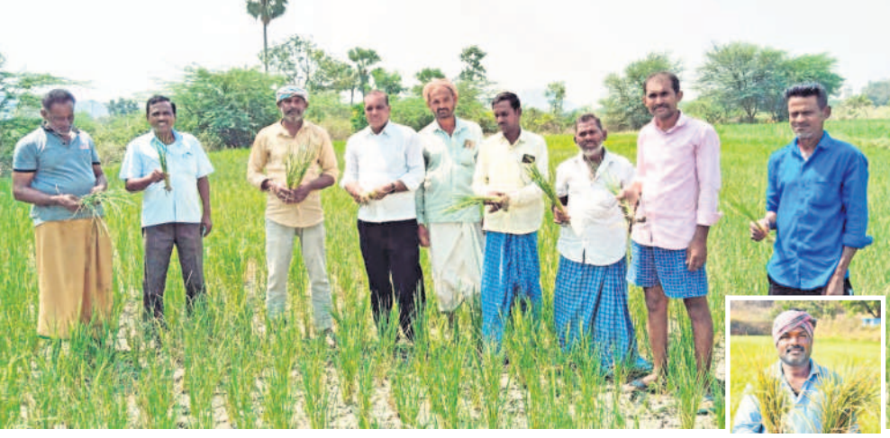
హుస్సాబాద్ మండలం కూచనపల్లి శివారులో అందిపోయిన వరి పంటను చూపుతున్న రైతులు

హుస్సాబాద్, మే 15: యాసంగి పంట మొట్టమొదటగా ముంబయి. గతేడాది తొలి పోలికే ఈ ఏడాది యాసంగి పంట దిగుబడులు సగానికి సగం పడిపోవడంతో రైతులు తీవ్రంగా నష్టపోయారు. మెట్ట ప్రాంతం పంటను చూస్తూనే ఉన్నా, అక్కడనే మండలం లాలో గడిచిన పదేళ్లు ఎలాంటి అవాంతరాలు లేకుండా యాసంగి పంటలు పండించుకుంటూ వస్తున్నారని తేలుతోంది. యాసంగి పంటలు పండించుకుంటూ వస్తున్నారని తేలుతోంది. యాసంగి పంటలు పండించుకుంటూ వస్తున్నారని తేలుతోంది. యాసంగి పంటలు పండించుకుంటూ వస్తున్నారని తేలుతోంది. యాసంగి పంటలు పండించుకుంటూ వస్తున్నారని తేలుతోంది.