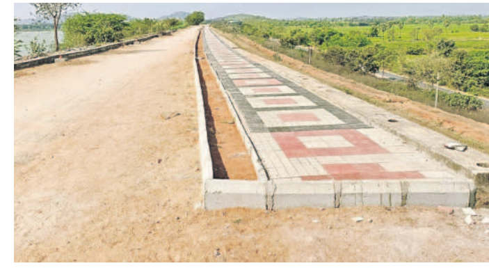
మధ్యలోనే ఆగిపోయిన ఎల్లమ్మ చెరువు కట్టపై వాకింగ్ ట్రాక్ పనులు