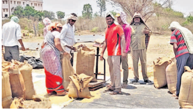
హుస్సాబాద్ మార్కెట్ యార్డు కొనుగోలు కేంద్రంలో వడ్లను తూకం వేస్తున్న హమాబీలు