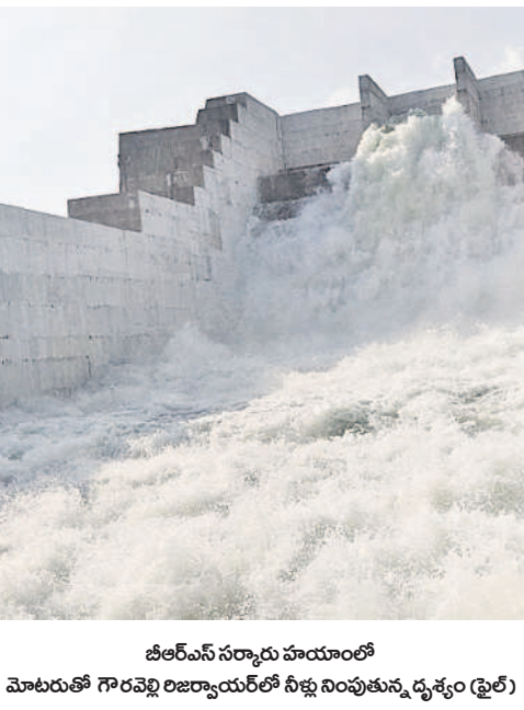
బీఆర్ఎస్ సర్కారు హయాంలో మోటారుతో గౌరవెలి రిజర్వాయర్లో నీళ్లు నింపుతున్న దృశ్యం (ఫైర్)