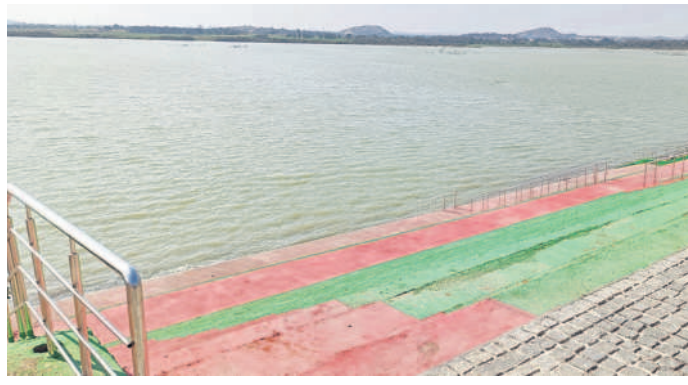
హుస్సాబాద్ ఎల్లమ్మ చెరువుకు బతుకమ్మ ఫూట్ లాండ్ నిర్మించిన మెట్లు, స్టీల్ రేలింగ్