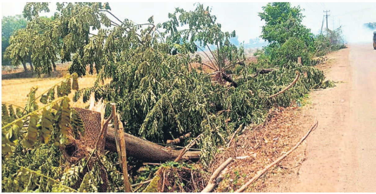
పెద్దపల్లి జిల్లా ముత్తారంలో నలకైన చెట్లు