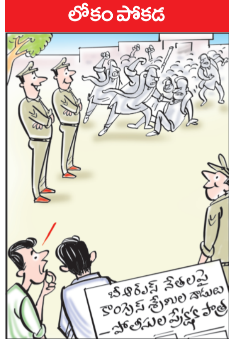
ప్రెండ్లీ పోలీసింగ్ లంటే దాడుల చేసే వాళ్లతో ప్రెండ్లీగా వుండడమా?