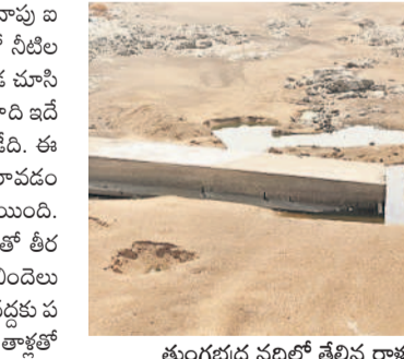
తుంగభద్ర నదిలో తేలిన రాళ్లు, రప్పలు

అయిది, మే 14 : తుంగభద్ర నది తడారించింది. దాదాపు ఐదు నెలలుగా నీటి ప్రవాహం అడుగంటింది. నదిలో నీటి లభ్యత లేకుండా పోయింది. ప్రస్తుతం రాళ్లు తేలి ఎక్కడ చూసినా ఇసుక మేటలు కనిపిస్తూ నీటిజాడ కరువైంది. గతేడాది ఇదే సమయంలో నదిలో నీటి ప్రవాహం స్వల్పంగా ఉండేది. ఈ ఏడాది ఎర్రవ నుంచి వరద అంతంత మాత్రంగానే రావడంతో అక్షిణి, నవంబర్ నెలల్లోనే ప్రవాహం నిలిచిపోయింది. ప్రస్తుతం నదిలో చుక్క నీరు కనిపించిన దుస్థితి. దీంతో తీర ప్రాంత పల్లెల్లో గొంతెండుతున్నది. నీళ్ల కోసం ఖాళీ బిందెలు పట్టుకొని కిలోమీటర్ల దూరంలోని వ్యవసాయ బోర్ల వద్దకు పరుగులు పెడుతున్నారు. మరికొందరు బైకెలు, సైకిళ్లపై తాళ్లతో బిందెలు కట్టుకొని నీటిని తెచ్చుకుంటున్నారు. తాగునీటి కోసం ప్రజలు అలమటిస్తున్నారు. కొందరికే నదిలో వెలిమెల ద్వారా నీటిని తెచ్చుకుంటున్నారు. తెలంగాణ-ఏపీ సరిహద్దులోని నదిలో రెండు, మూడు కిలోమీటర్ల వెళ్లి.. సుమారు 2 గంటల పాటు నీటిని తోడి తెచ్చుకుంటున్నారు. ప్రజలతోపాటు పశుపక్షా