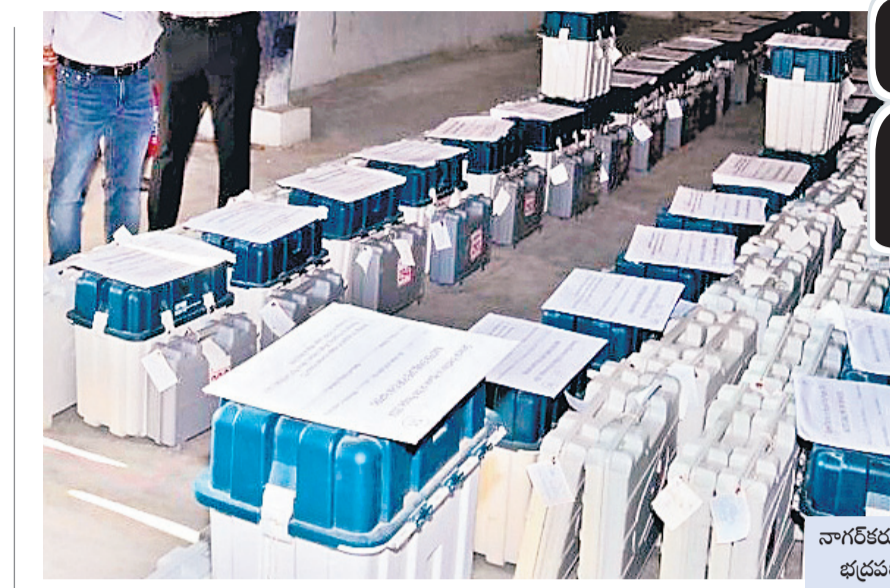
నాగర్ కర్నూల్ స్టాండ్ గృహంలో భద్రపరిచిన ఈవీఎంలు