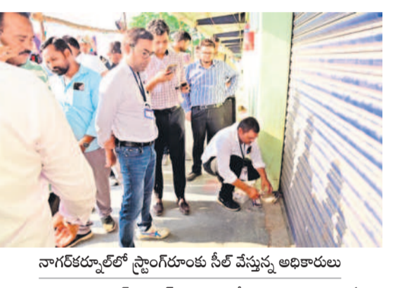
నాగర్ కర్నూల్ స్టాండ్ గృహం నీటి వేస్తున్న అధికారులు