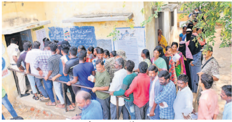
గద్వాల నియోజకవర్గంలో సోమవారం ఓటిసేందుకు బూడులుదీరిన ప్రజలు