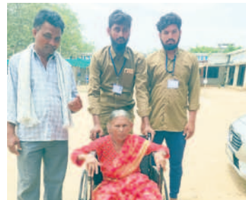
వింతలపాలెంలో పుచ్చరాలిని ఓటు వేసేందుకు వీలైనాలో తీసుకెళ్లిన గ్రామ పంచాయతీ సీబి