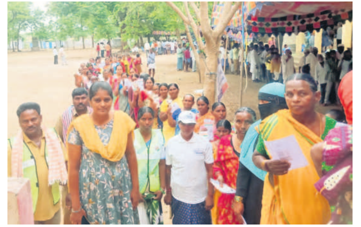
మోతెలో ఓటుహక్కు వినియోగించుకునేందుకు బారులు దీలిన ఓటర్లు