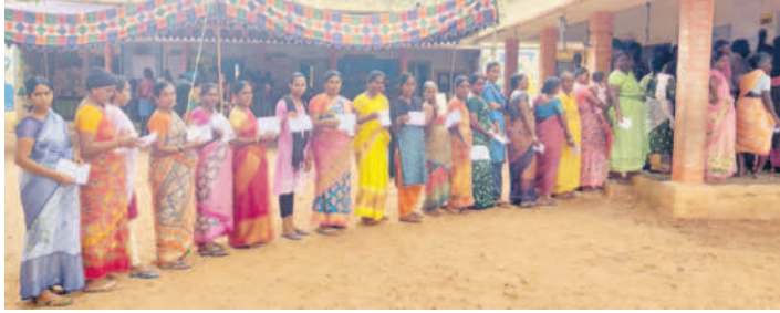
నేరేడుపల్లె మండలం మేడారం పోలింగ్ కేంద్రం వద్ద బారులు దీలిన ఓటర్లు