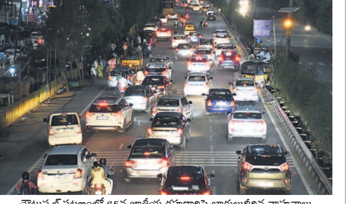
చౌటుప్పల్ పట్టణంలో 65వ జాతీయ రహదారిపై బారులు దీలిన వాహనాలు

చౌటుప్పల్, మే 13 : యాదాద్రి భువనగిరి జిల్లా చౌటుప్పల్ మండల వ్యాప్తంగా 65వ జాతీయ రహదారిపై సోమవారం వాహనాలు బారులు దీలాయి. ఎన్నికల సేవలకు హైదరాబాద్లో ఉన్న తెలంగాణ, ఆంధ్రప్రదేశ్ రాష్ట్రాల్లోని ప్రజలు ఓటు వేసేందుకు సొంతాళ్లకు వెళ్లి తిరిగి పట్టుం బాట పట్టడంతో ట్రాఫిక్కు అంతరాయం ఏర్పడింది. హైదరాబాద్ వైపు వాహనాల అధిక సంఖ్యలో వెళ్లాయి. అందులో అత్యధికంగా కార్లు ఉన్నాయి.