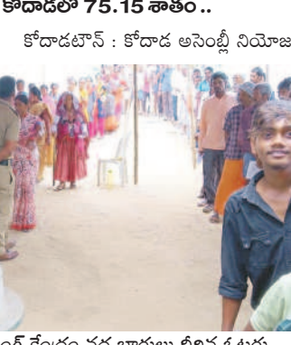
అత్యధికం: పోలింగ్ కేంద్రం వద్ద బారులు దీలిన ఓటర్లు