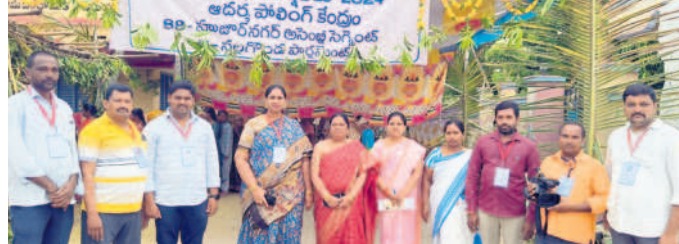
గంజేపల్లిలో ఏర్పాటు చేసిన అదర్స్ పోలింగ్ కేంద్రం వద్ద అధికారులు, సిబ్బంది