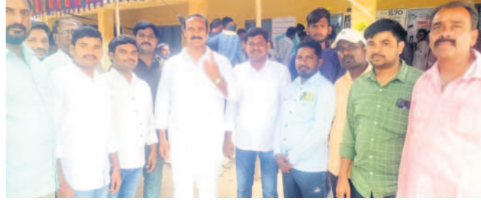
నడిగూడెం : కలివారంలో ఓటు హక్కు వినియోగించుకున్న మాజీ ఎమ్మెల్యే బొల్లం మల్లయ్య