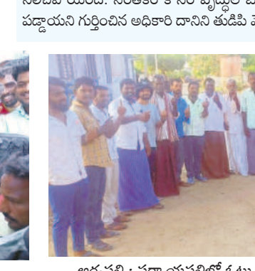
అత్యధికం: పోలింగ్ కేంద్రం వద్ద బారులు దీలిన ఓటర్లు