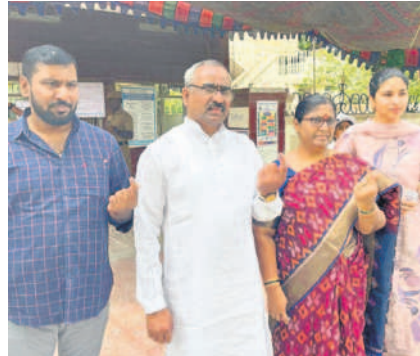
ఓటుహక్కు వినియోగించుకున్న మాజీ ఎమ్మెల్యే సంతిపేటి వెంకటేశ్వరరావు దంపతులు