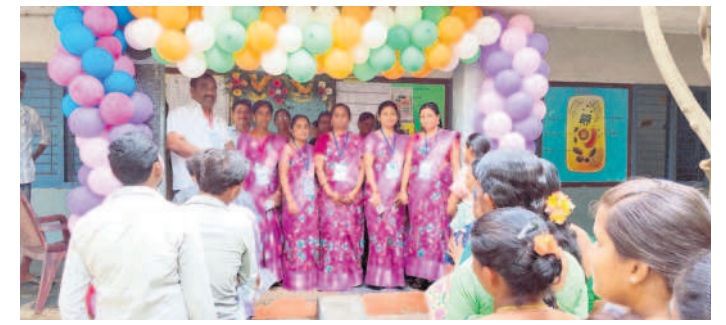
వింతలపాలెం : దొండపాడులో మహిళల కోసం ప్రత్యేకంగా ఏర్పాటు చేసిన పోలింగ్ బూత్