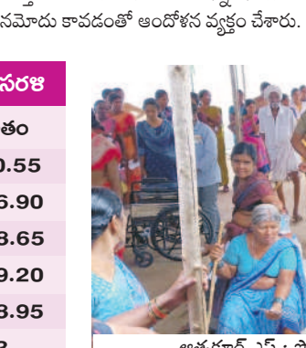
అత్యధికం: పోలింగ్ కేంద్రం వద్ద బారులు దీలిన ఓటర్లు