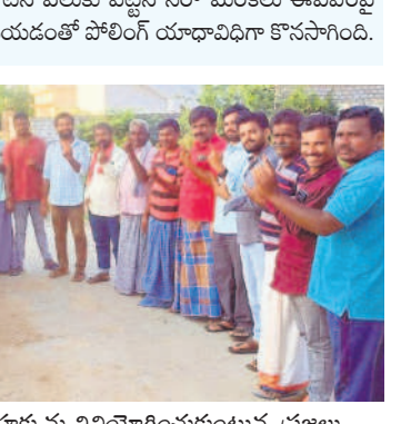
అత్యధికం: పోలింగ్ కేంద్రం వద్ద బారులు దీలిన ఓటర్లు

నింగారంలో రి పోలింగ్ నిర్వహించాలని ఫిర్యాదు రాజాపేట, మే 13 : యాదాద్రి భువనగిరి జిల్లా రాజాపేట మండలంలోని నింగారం గ్రామంలో రి పోలింగ్ నిర్వహించాలని బీజేపీ నాయకులు ఎన్నికల అధికారికి ఫిర్యాదు చేశారు. గ్రామంలోని 86వ పోలింగ్ బూత్లో ఈవీలపై చేతి గుర్తు వద్ద మార్కెట్ గుర్తు ఉన్నదని, దానిపై ఓటు వేయాలని బయట కాంగ్రెస్ నాయకులు ప్రచారం నిర్వహిస్తున్నారని బీజేపీ నాయకులు ఆందోళన చేశారు. సదరు బూత్లో రి పోలింగ్ నిర్వహించాలని డిమాండ్ చేశారు. దాంతో మధ్యాహ్నం 2:50 నుంచి 3:30 గంటల వరకు 40 నిమిషాలపాటు పోలింగ్ నిలిపివేయింది. సంతకం కోసం వృద్ధులు బోటన వేలుకు వెళ్లిన సీనియర్ మరకలు ఈవీలపై పడ్డాయని గుర్తించిన అధికారి దానిని తుడిచి వేయడంతో పోలింగ్ యాదాద్రిగా కొనసాగింది.