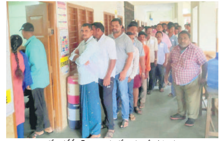
కోదాడ సీనీరెడ్డి విద్యాలయంలో బారులు తీలిన ఓటర్లు