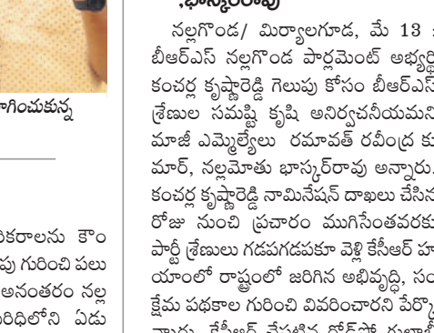
కంచర్ల గిలుపును జిఆర్ఎస్ శ్రేణుల సమష్టి కృషి అనిర్వచనీయం