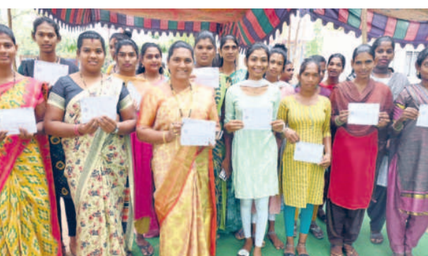
నల్లగొండలోని బోయగూడలో ఓటింగ్ వచ్చిన ట్రాన్స్ జెండర్స్