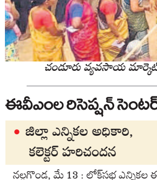
చందూరు వ్యవసాయ మార్కెట్లో ఏర్పాటు చేసిన పోలింగ్ కేంద్రం వద్ద బారులు తీరిన ఓటర్లు