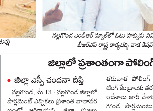
జిల్లాలో ప్రశాంతంగా పోలింగ్