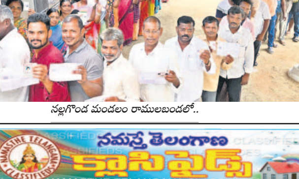
నల్లగొండ మండలం రాములబండలో..