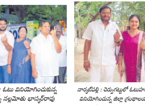
మిర్యాలగూడ : ఓటు వినియోగించుకున్న మాజీ ఎమ్మెల్యే నల్లమోతు భాస్కర్ రావు కుటుంబ సభ్యులు