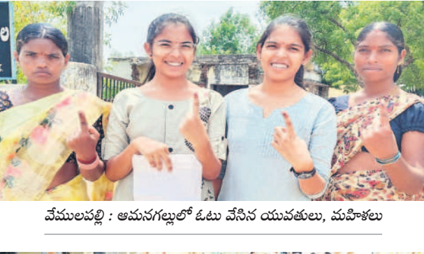
వేములపల్లి : అనునగల్లలో ఓటు వేసిన యువతులు, మహిళలు