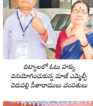
విట్టాలలో ఓటు హక్కు వినియోగించుకున్న మాజీ ఎమ్మెల్యే చెరుపల్లి సీతారామలు దంపతులు