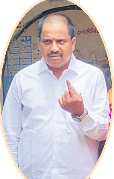
అమనగల్లు: ఖాసాపూర్లో ఓటు వేసిన కల్వకుర్తి ఎమ్మెల్యే కనీరెడ్డి నారాయణరెడ్డి