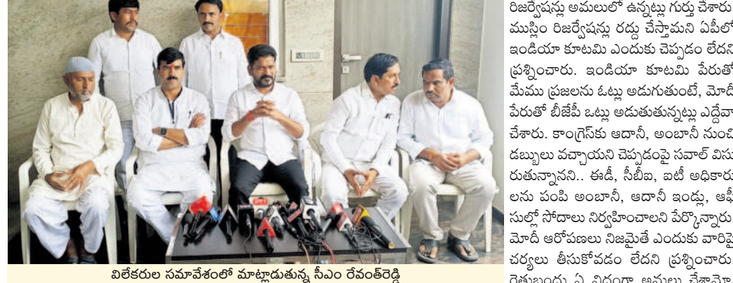
విలక్షణకల సమావేశంలో మాట్లాడుతున్న సీఎం రేవంకరెడ్డి

కొడంగల్, మే 13 : కేంద్రంలో ఇండియా కూటమి అధికారంలోకి రావడం ఖాయమని సీఎం రేవంకరెడ్డి తెలిపారు. సోమవారం పార్లమెంటు ఎన్నికల్లో భాగంగా వికారాబాద్ జిల్లా కొడంగల్లో ఓటు వేసిన అనంతరం తన నివాసంలో ఏర్పాటు చేసిన విలక్షణకల సమావేశంలో ఆయన మాట్లాడారు. ప్రధాని నరేంద్రమోదీకి 75 సంవత్సరాల నిండనున్నాయని, ఏజ్ లిమిట్ అమలు చేస్తే ఎవరు ప్రధాని అనేది బీజేపీ తేల్చుకోవాలని సవాల్ విసిరారు. బీజేపీ 398 సీట్లలో మాత్రమే పోటీ చేస్తున్నదని, 400ల సీట్లు రావడం ఏ విధంగా సాధ్యమని ప్రశ్నించారు. దీన్ని బట్టి చూస్తే.. దేశంలో ఇండియా కూటమి