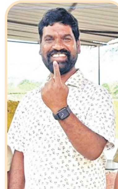
చేపల్లె రూరల్: పామినలో ఓటిసిన బత్తిరి సత్తి