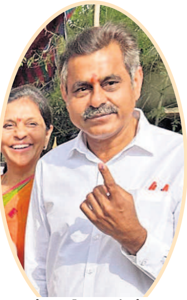
చేపల్లె రూరల్: గొల్లపల్లిలో ఓటిసిన చేపల్లె బీజేపీ ఎంపీ అభ్యర్థి కొండా విశ్వేశ్వరరెడ్డి