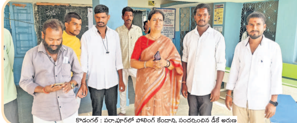
కోడంగల్: పాపూర్లో పోలింగ్ కేంద్రాన్ని సందర్శించిన డీకే అరుణ