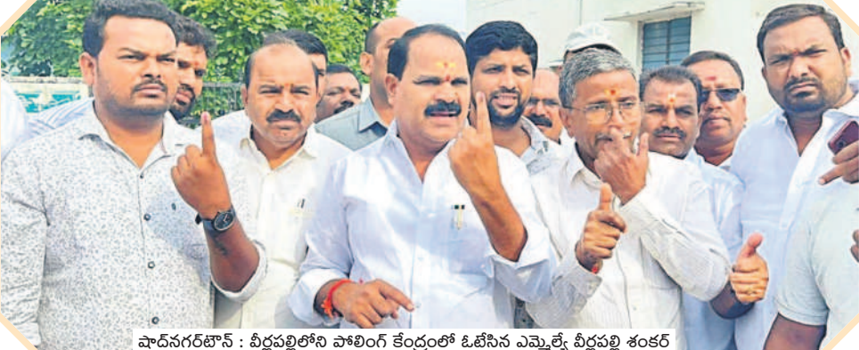
పాదనగరం: వీరపల్లిలోని పోలింగ్ కేంద్రంలో ఓటిసిన ఎమ్మెల్యే వీరపల్లి శంకర్