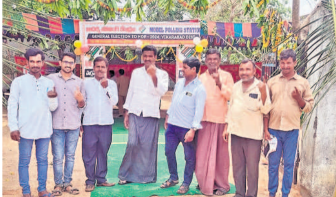
ధారూరు: బింకకుంట అదర్ల పోలింగ్ కేంద్రంలో..