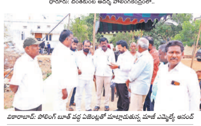
వికారాబాద్: పోలింగ్ బూత్ వద్ద ఏజెంట్లతో మాట్లాడుతున్న మహిళా ఎమ్మెల్యే ఆనంద్