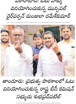
తాండూరు: ప్రభుత్వ పాఠశాలలో ఓటు వినియోగించుకున్న రాష్ట్ర బీసీ కమిషన్ సభ్యుడు శుభప్రదీప్ కేలే