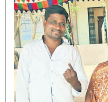
అబ్దుల్లాపూర్: ఓటు హక్కు వినియోగించుకున్న అబ్దుల్లాపూర్లో ఎంపీ