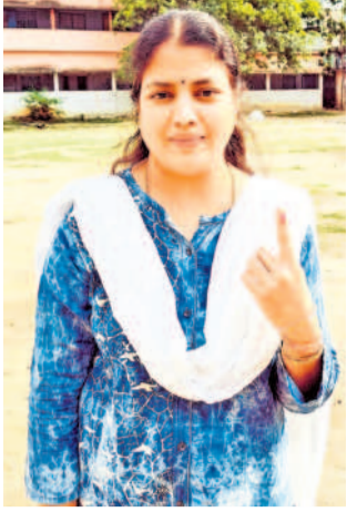
తాండూరు: ఓటు హక్కు వినియోగించుకున్న యువతి