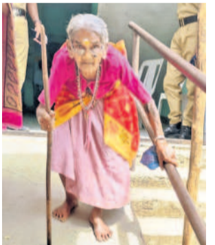
పరిగి: ఓటు వేసే వస్తున్న వృద్ధురాలు