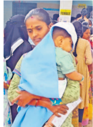
బొంరాసపేట: తుంజిమ్మిట్లలో చంటిపాపతో వచ్చి ఓటిసేన మహిళ