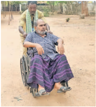
దోమ: ఓటు వేసేందుకు వెళుతున్న దివ్యాంగుడు