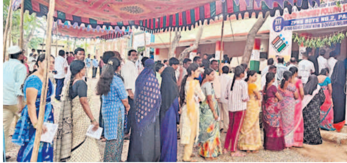
పరిగి: జడ్పీఎంఎస్ నెం.2లో బారులు తీలిన ఓటర్లు