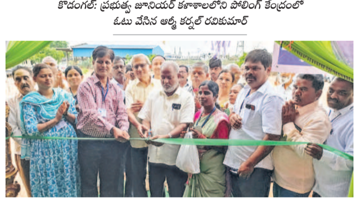
కొడంగల్: మాడల్ పోలింగ్ కేంద్రాన్ని ప్రారంభిస్తున్న ఓటర్లు