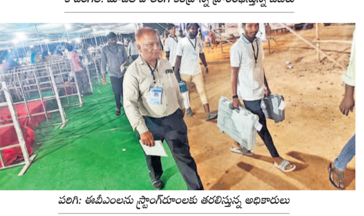
పరిగి: ఈవీఎలను స్టాంబింగ్ చేయడానికి తరలిస్తున్న అధికారులు