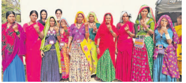
బొంరాసపేట: మెట్లకుంటలో ఓటు హక్కు వినియోగించుకున్న గిరిజన మహిళలు