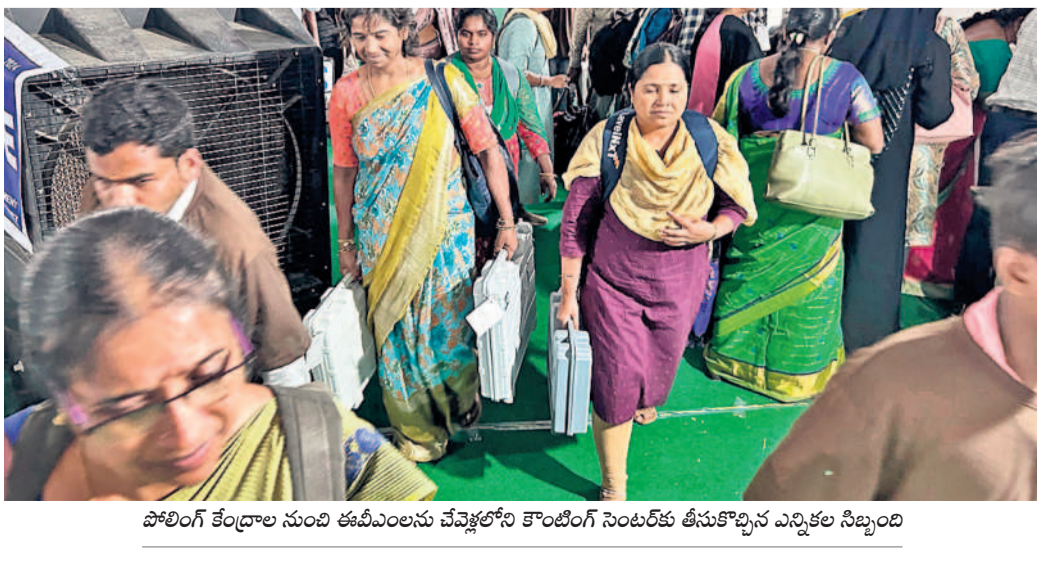
పోలింగ్ కేంద్రాల నుంచి ఈవీఎలను చేపట్టే కొంటింగ్ సెంటర్లకు తీసుకొచ్చిన ఎన్నికల సిబ్బంది