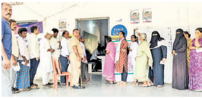
తాండూరు : ఓటిసేనకు క్యూలో ఉన్న ఓటర్లు