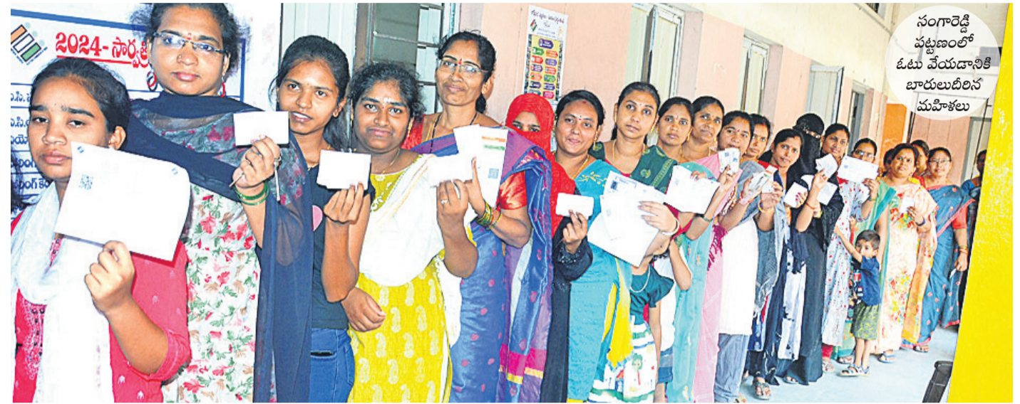
సంగారెడ్డి పట్టణంలో ఓటు వేయడానికి బారులుదీరిన మహిళలు

సంగారెడ్డి, మే 18(నమస్తే తెలంగాణ): చెరువుమధ్య పుటలను మినహా జూరూబాద్ పార్లమెంట్లో ఎన్నికలు ప్రశాంతంగా ముగిశాయి. జూరూబాద్ పార్లమెంట్లో సోమవారం ఉదయం 7 గంటల నుంచి సాయంత్రం 8 గంటల వరకు పోలింగ్ జరిగింది. సాయంత్రం 8 గంటల తర్వాత కూడా పలు పోలింగ్ కేంద్రాల్లో ఓటు ఓటాల్ని వేసే పోలింగ్ కేంద్రాల్లో కొనసాగింది. జూరూబాద్ పార్లమెంట్ పరిధిలోని 1971 పోలింగ్ కేంద్రాల్లో ఉదయం 7 గంటల నుంచి పోలింగ్ ప్రారంభమైంది. ఉదయం మండకొడిగా ప్రారంభమైన పోలింగ్ ఆ తర్వాత క్రమంగా పుంజుకుంది. ఓటర్లు ఎండను కూడా లెక్క చేయకుండా పోలింగ్ కేంద్రాల్లో ఓటు హక్కును వినియోగించుకున్నారు. పుంజుకుంటూ సమానంగా మహిళలు ఓటింగ్లో పాల్గొంటున్నారన్నారు. జూరూబాద్ పార్లమెంట్లో రాజకీయ వ్యత్యాసాలు కలుపుకుపోయినా సమానంగా పోలింగ్లో పాల్గొన్నారు. జూరూబాద్ పార్లమెంట్లో రాజకీయ వ్యత్యాసాలు కలుపుకుపోయినా సమానంగా పోలింగ్లో పాల్గొన్నారు. జూరూబాద్ పార్లమెంట్లో రాజకీయ వ్యత్యాసాలు కలుపుకుపోయినా సమానంగా పోలింగ్లో పాల్గొన్నారు.