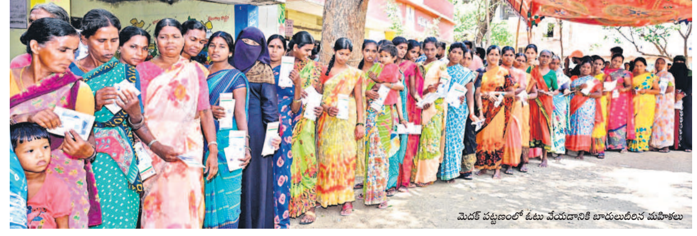
మెడక్ పట్టణంలో ఓటు వేయడానికి బారులుదీరిన మహిళలు