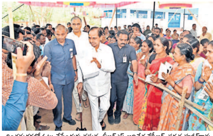
చింతమడకలో ఓటు వేసేందుకు వచ్చిన బీఆర్ఎస్ అభినేత కేసీఆర్, పక్కన హరీశ్ రావు