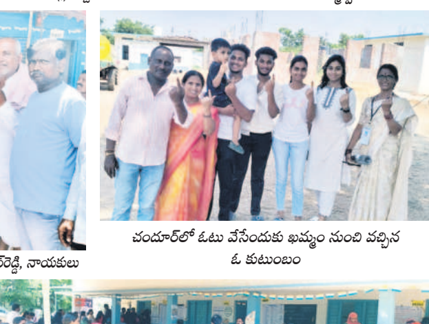
చందూర్లో ఓటు వేసేందుకు ఖమ్మం నుంచి వచ్చిన ఓ కుటుంబం