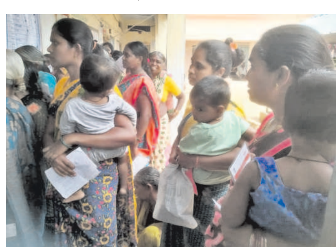
ఫాలగిరిలో బిన్న పిల్లలను ఎత్తుకొని క్యూలో నిలబడిన మహిళలు