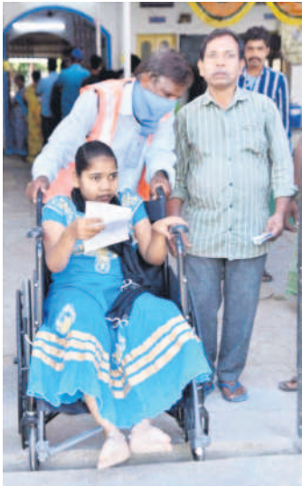
జిల్లాకేంద్రంలో ఓటు వేసేందుకు వీల్చైర్లపై వచ్చిన దివ్యాంగ యువతి