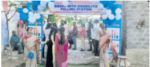
భీమగల్లో ఏర్పాటు చేసిన మాడల్ పోలింగ్ బూత్