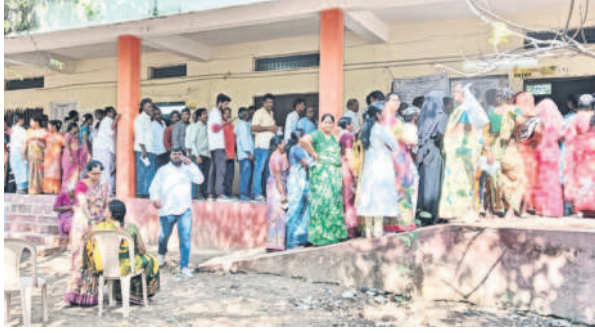
ధర్మవరంలో ఈవీఎం మొరాయింపడంతో వేచిపూస్తున్న ఓటర్లు