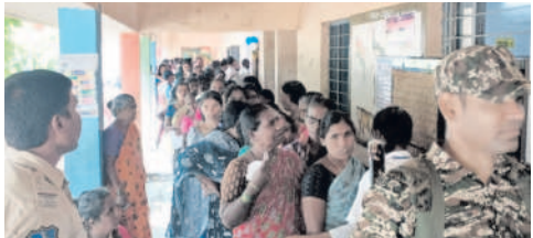
ముప్పాల మండలం కేంద్రంలో బారులుతీరిన ఓటర్లు