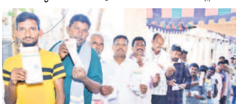
ఫాలగిరి మండలం కలకర్లో బారులు తీరిన ఓటర్లు