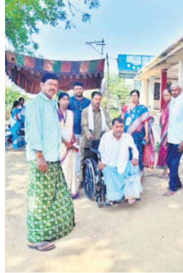
చందూర్ మండలం లక్కాపూర్లో పక్షవాతంతో బాధపడుతూ ఓటు వేసేందుకు వచ్చిన వృద్ధుడు