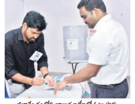
జిల్లాకేంద్రంలోని బాలుర బడిలో ఓటు హక్కు వినియోగించుకుంటున్న కలెక్టర్ రాజీవ్ గాంధీ హాన్డుతు