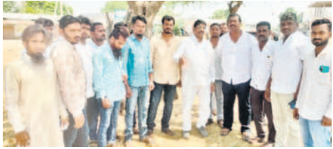
రెంజెట్ మండలం సాహపూర్లో ఎన్నికల సరళిని తెలుసుకుంటున్న జడ్పీవైర్లకు విలేజ్ లాపు