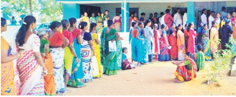
ధర్మవరంలో ఓటు వేసేందుకు బారులు తీరిన ఓటర్లు