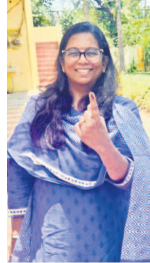
ఓటు హక్కు వినియోగించుకున్న జిల్లా జడ్పీ సునీత కుంచాల