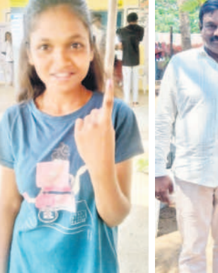
దోంచందలో మొదటిసారి ఓటు వేసిన యువతి