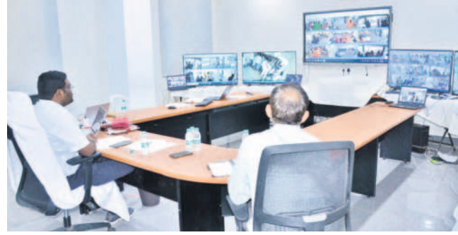
కంట్లో రూంలో పోలింగ్ సరళిని పరిశీలిస్తున్న కలెక్టర్ రాజీవ్ గాంధీ హాన్డుతు