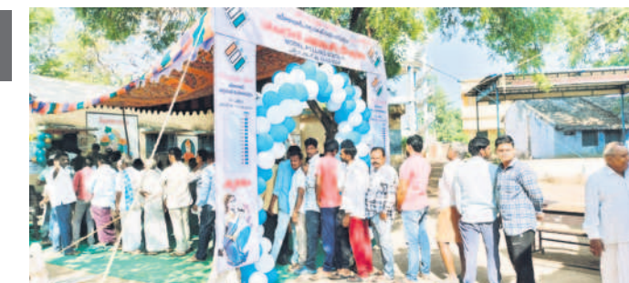
వెత్తొండలో మాడల్ పోలింగ్ కేంద్రం వద్ద బారులు తీరిన ఓటర్లు