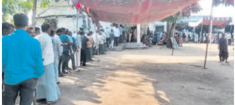
మెరలా మండలం తిమ్మాపూర్లో ఓటు వేసేందుకు బారులు తీరిన ప్రజలు