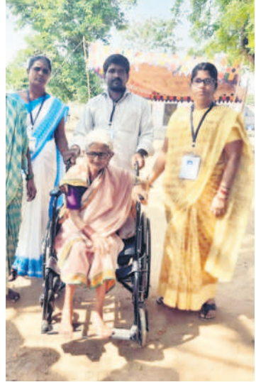
రుద్రూలో వృద్ధులైన వీల్చైర్లపై తీసుకువచ్చిన నిబంధి