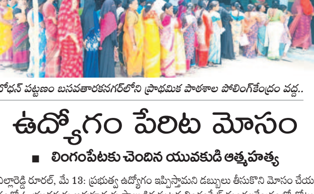
బోధన్ పట్టణం బసవతారకనగర్లోని ప్రాథమిక పాఠశాల పోలింగ్ కేంద్రం వద్ద..