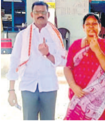
తిర్యాలి: దంతలవారిలో ఎమ్మెల్యే తో పాటు, కుటుంబ సభ్యులు..