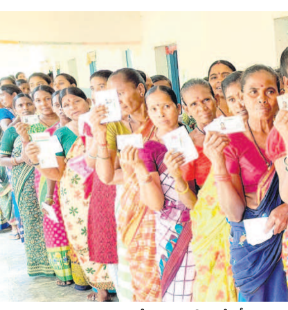
దండేపల్లి: మామిడిపల్లిలో విడికార్లు చూపుతున్న క్యూలైన్లో మహిళా ఓటర్లు