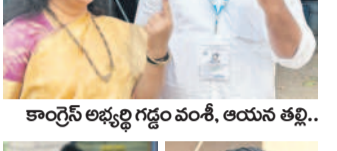
ఓటు హక్కు వినియోగించుకున్న అభ్యర్థులు కొద్దిమంది ఆసిఫాబాద్, గోమాన శ్రీనివాస్