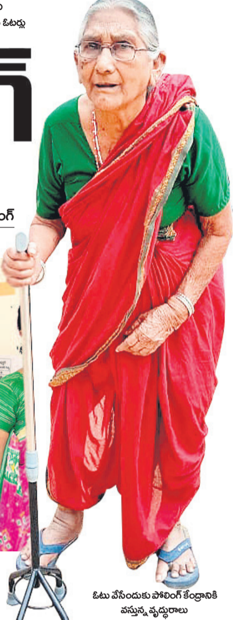
ఓటు వేసేందుకు పోలింగ్ కేంద్రానికి వస్తున్న వృద్ధురాలు