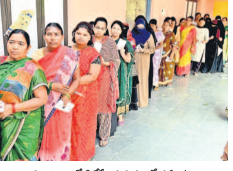
మంచీర్యాలలో ఓటింగ్ కు క్యూలో మహిళలు