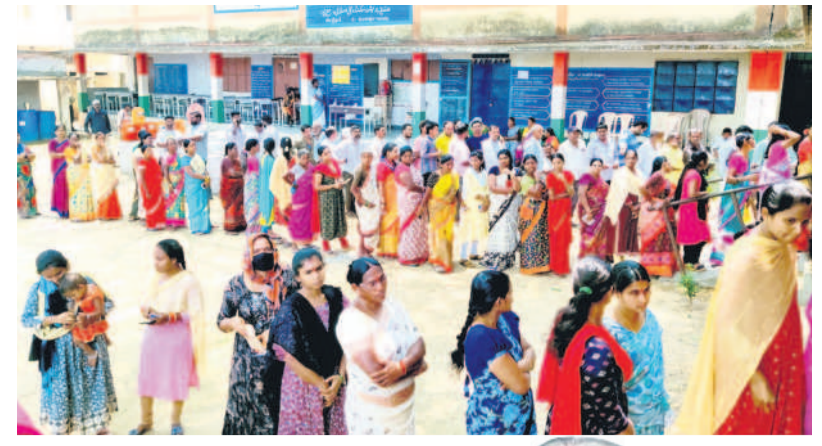
జైపూర్ మండల కేంద్రంలోని పోలింగ్ బూత్ వద్ద భార్యలు తీరిక పట్టుకుంటున్నాయి

5 మంగళవారం 14 మే 2024 MANCHERIAL KUMURAM BHEEM ASIFABAD