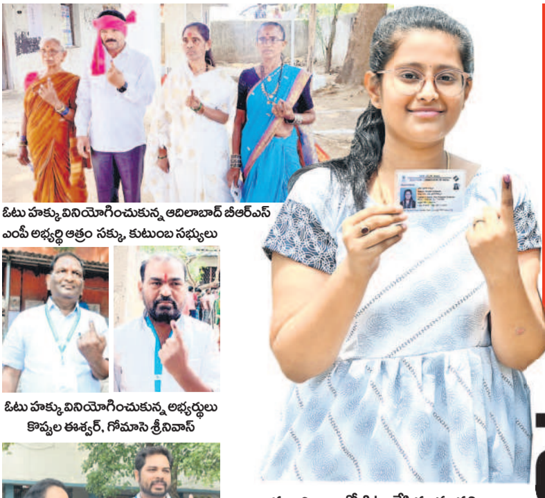
మంచీర్యాలలో ఓటు వేసిన యువతి