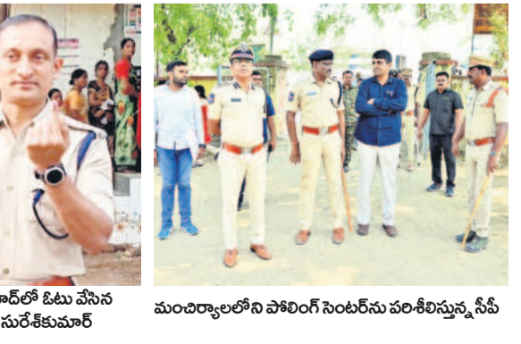
ఆసిఫాబాద్లో ఓటు వేసిన ఎస్పీ సురేంద్రమూర్తి