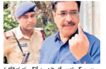
ఓటేసిన మలక్పేట ఎమ్మెల్యే అహ్మద్ బలూల

పాత నగరంలో.. పేటబాద్: పార్లమెంట్ ఎన్నికలు మలక్పేట, యాకత్ పురా నియోజక వర్గాల్లో స్వల్ప సంఘటనల మినహా ప్రశాంతంగా ఎన్నికలు జరిగాయి. సోమవారం ఉదయం 7 గంటలకు ప్రారంభమైన ఎన్నికల ప్రక్రియ సాయంత్రం 6 వరకు కొనసాగింది. ఓటు వేయటానికి