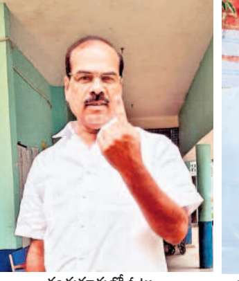
కందుకూరులో ఓటు వేసిన జడ్పీటీసీ జంగారెడ్డి