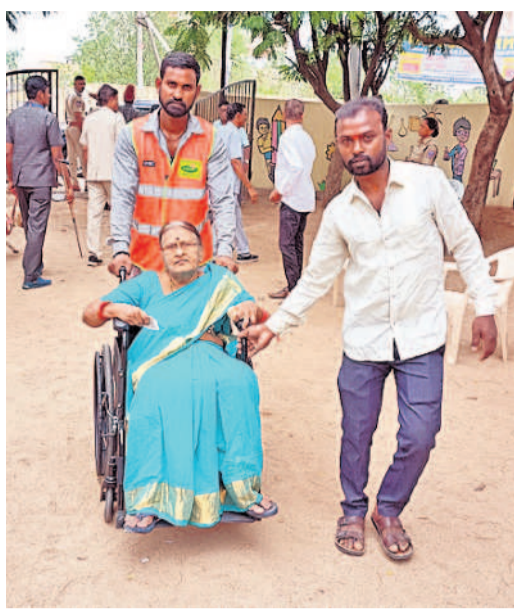
మన్యూరాబాద్ ప్రభుత్వ ఉన్నత పాఠశాలలో ఓటు వేసేందుకు వ్యర్థరాలిని వీలైతే తీసుకువస్తున్న సినింది