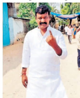
ఓటు హక్కు వినియోగించుకున్న కార్పొరేటర్ కొప్పల సర్పంచర్ రెడ్డి