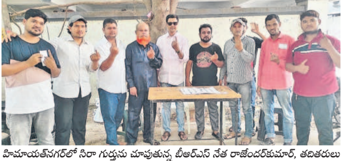
హిమాయత్ నగర్ లో సీనియర్లు మూపుతున్న బీఆర్ఎస్ నేత రాజేంద్రకర్ మూర్తి, తదితరులు