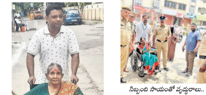
సిబ్బంది సాయంతో వృద్ధురాలు..