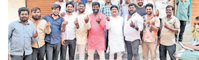
మైలారదేవ్ పల్లి లక్ష్మీగూడలో సీనియర్లు మూపుతున్న యువకులు