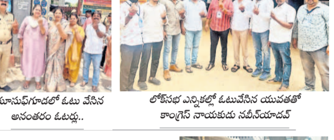
లోక్ సభ ఎన్నికల్లో మొదటిసారి ఓటు హక్కును వినియోగించుకున్న యువ ఓటర్లు