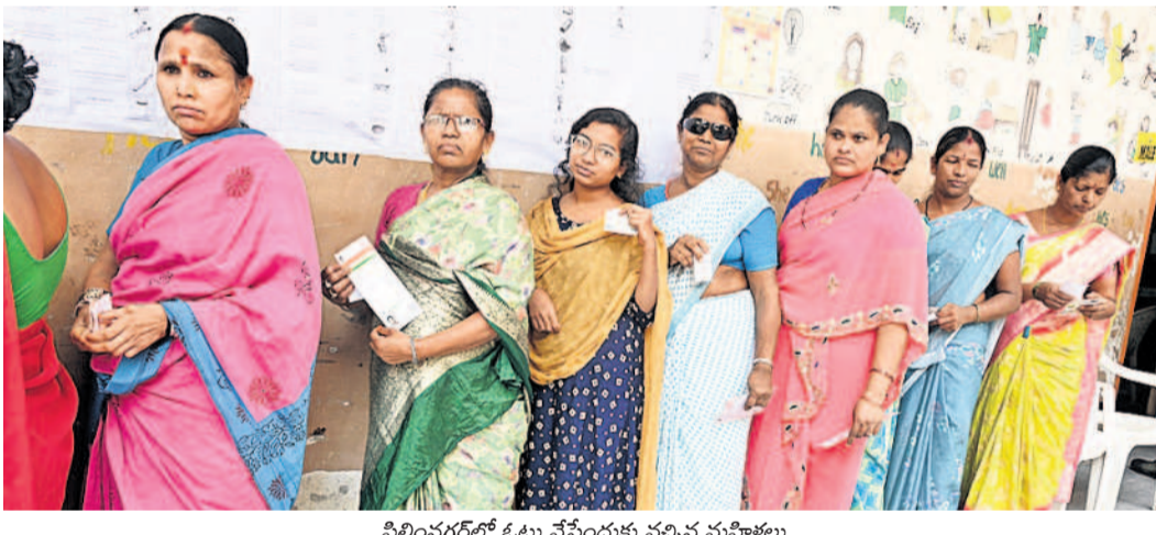
ఫిలిం నగర్ లో ఓటు వేసేందుకు వచ్చిన మహిళలు