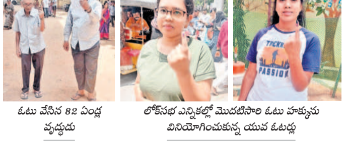
ఓటు వేసిన 82 ఏండ్ల వృద్ధుడు