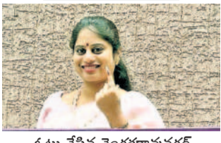
ఓటు వేసిన వెంకటాచలం కార్పొరేటర్ దేవిప్య