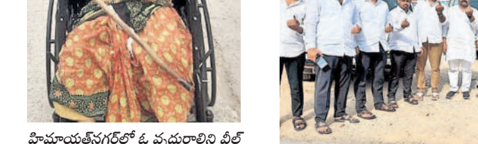
హిమాయత్ నగర్ లో ఓటు హక్కును వినియోగించుకున్న వృద్ధులతో కలిసి వచ్చిన వృద్ధులు