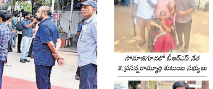
యూ.సుప్రగూడలో ఓటు వేసిన అనంతరం ఓటర్లు..