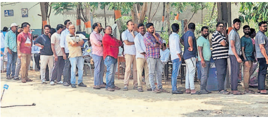
రాజేంద్రనగర్ నియోజకవర్గంలోని నార్సింగ్ పోలింగ్ కేంద్రంలో బారులు తీరిన ఓటర్లు

పుణ్య సాగినప్పటికీ పోలింగ్ బూత్ ల దొరకపోవడంతో అనేక మంది ఓటర్లు ఇబ్బందులను ఎదుర్కొవలసి వచ్చింది. వెబ్ కార్యక్రమం ఏర్పాటుతో పోలీసు అధికారులు సైతం మంచి సహకారాన్ని అందించారు. కొన్ని పోలింగ్ స్థానాల్లో తాగునీటి పునరుద్ధరణ కల్పించడంతో ఓటర్లు ఇబ్బంది పడారు. సున్నితమైన ప్రాంతాల్లో పోలీసు బలగాలు ముందుగానే దృష్టిసారించి పటిష్టమైన చర్యలు చేపట్టి ఎన్నికలను సజావుగా నిర్వహించేందుకు తోడ్పాటునందించారు. కొన్ని చోట్ల ఈవీఎంల మొరాయింపాయి.