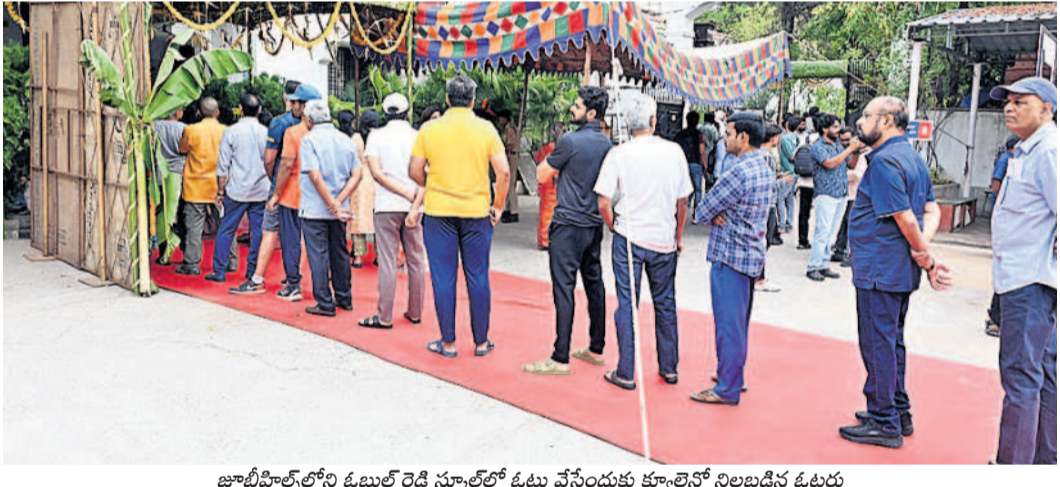
జూబ్లీహిల్స్ లోని ఓటర్ రెడ్డి స్కూల్ లో ఓటు వేసేందుకు క్యూలైన్లో నిలబడిన ఓటర్లు