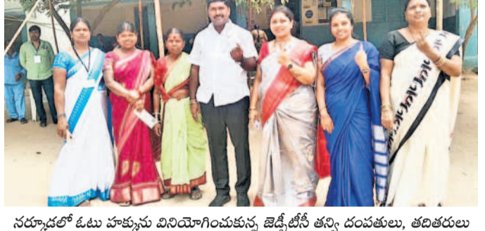
నర్సూరులో ఓటు హక్కును వినియోగించుకున్న జెడ్పీటీసీ తస్మి దంపతులు, తదితరులు