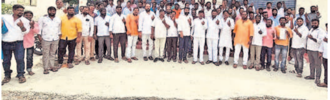
ఖానాపూర్ లో ఓటు హక్కును వినియోగించుకున్న నాయకులు, ప్రజలు