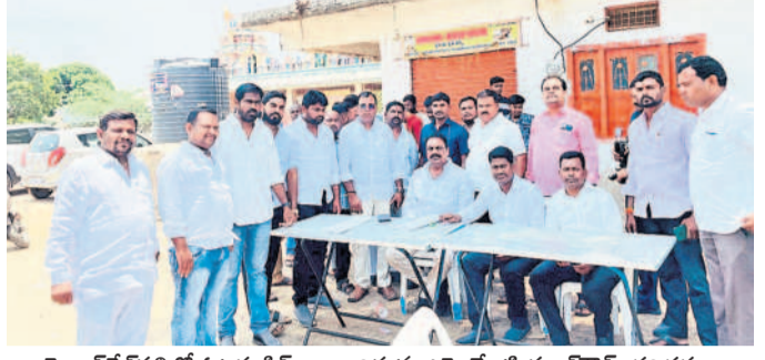
మైలారదేవ్ పల్లిలో ఓటర్ల స్టాంపులు అందిస్తున్న ఎమ్మెల్యే టి. ప్రకాశ్ గౌడ్, తదితరులు