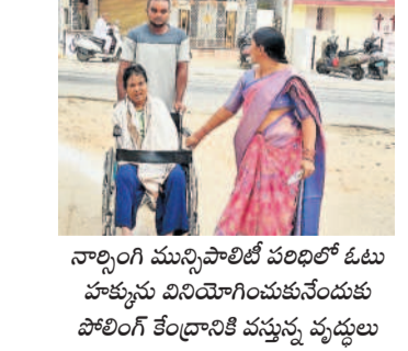
నార్సింగ్ మున్సిపాలిటీ పరిధిలో ఓటు హక్కును వినియోగించుకునేందుకు పోలింగ్ కేంద్రానికి వస్తున్న వృద్ధులు