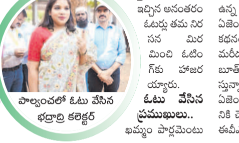
పాల్యంపల్లి ఓటు వేసిన భద్రాద్రి కల్లెకర్ల