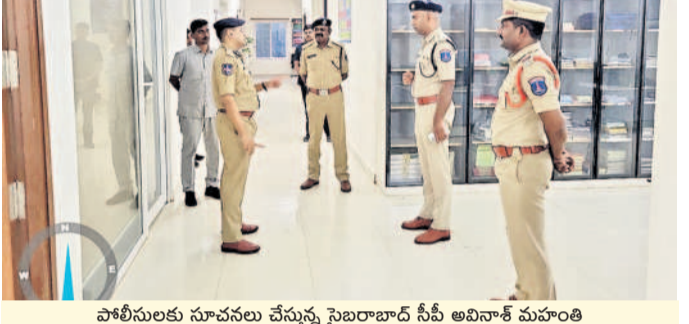
పోలీసులకు సూచనలు చేస్తున్న సైబరాబాద్ సీపీ అవినాశ్ మహాంతి

కడ్రాల్ పోలీస్ స్టేషన్లో పాటు పోలింగ్ కేంద్రాలను సందర్శించిన సైబరాబాద్ సీపీ