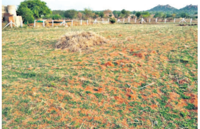
వేసవి దుక్కుల కోసం పంట పాలాలను సిద్ధం చేస్తున్న రైతులు

దుక్కులు లోతుగా దున్నుకోవాలి దుక్కులను లోతుగా దున్నడం వల్ల నేల వదులై మొక్క తయారవుతుంది. తొలకరి వర్షాలు వడిన వెంటనే నీరు పల్లవమై పొద్దు పంటల ఎక్కడిక్కడై పొలంలోనే ఇంకిపోతుంది. భూమికి ఎక్కువ రోజులు తేమ నిల్వ చేసుకునే సామర్థ్యం పెరుగుతుంది. దీనివల్ల పైరు వేసిన తర్వాత వర్షాలు పడటం కొద్దిగా అలసమైనా పంటకు నష్టం జరుగదు. పంటల కోతల తర్వాత నేలపై మిగిలే పంట మొదట్లో, పొలంలో మిగిలిన కలుపు మొక్కలు, పంటల నుంచి లాలిన డిసె ఆకుల వంటి వివిధ సున్నియ పదార్థాలన్నీ లోతు దుక్కు దున్నినప్పుడు నేలలో చేరుకుంటే నేలను లోతుగా దున్నినప్పుడు దీంతో నేలలో సేంద్రీయ పదార్థాలు, పోషక విలువలు పెరుగడానికి అవకాశం ఉంటుంది. లోతు దుక్కు దున్ను సిద్ధం చేసుకుంటే వానకాలానికి ఎంతో అనుకూలంగా ఉంటుందిని వ్యవసాయాధికారులు చెబుతున్నారు.