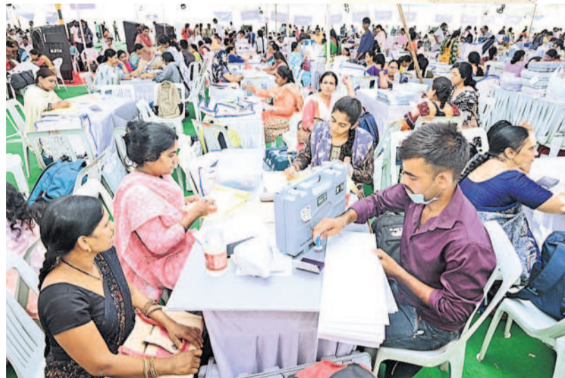
ఎన్నికల విధుల్లో పాల్గొనేందుకు చేపల్లెలోని డిస్ట్రిబ్యూషన్ సెంటర్ కు వచ్చిన ఉద్యోగులు

అధికారులను ఆదేశించారు. ఎలాంటి ఇబ్బందులు తలెత్తినా తమ దృష్టికి తేవాలని ఆర్.ఓలకు సూచించారు. కలెక్టర్ వెంట జిల్లా అదనపు కలెక్టర్ ప్రతిమా సింగ్, సహాయక రిటర్నింగ్ అధికారి సాయిరాం, సంబంధిత అధికారులు ఉన్నారు.