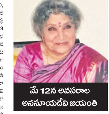
మే 12న అపరాల అనసూయదేవి జయంతి