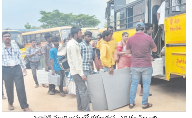
ఎల్లారెడ్డి నుంచి బస్సులో తరలుతున్న ఎన్నికల సిబ్బంది