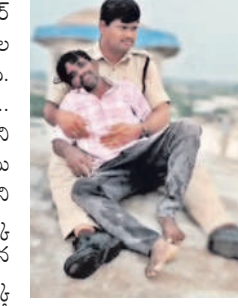
బాధితుడిని రక్షిస్తున్న పోలీసు