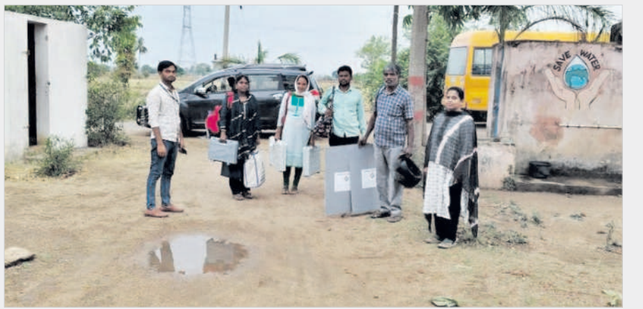
ఎన్నికల సామగ్రితో రామారెడ్డిలోని పోలింగ్ కేంద్రం వద్ద సిబ్బంది