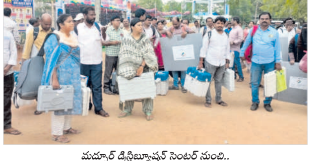
మధ్యపల్లి డిస్ట్రిబ్యూషన్ సెంటర్ నుంచి..