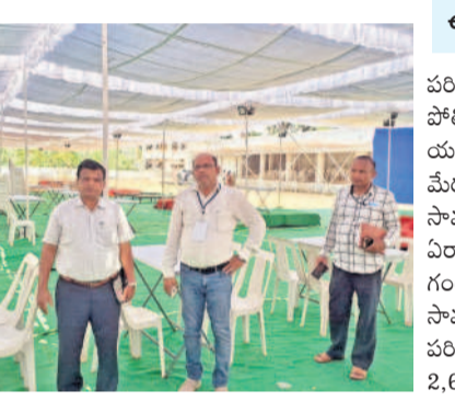
డిప్యూటీ సీటీఎం రింగానాయక్ పరిశీలిస్తున్న అడ్మినిస్ట్రేటివ్ వాసుచందర్