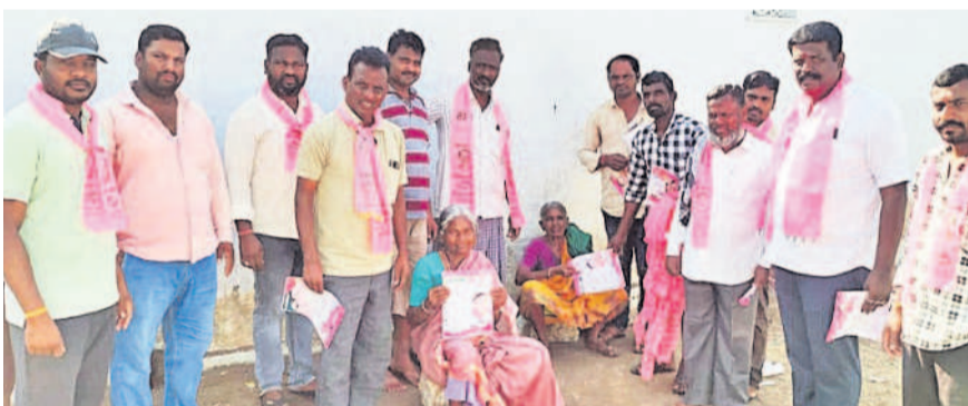
ధారూరు : నాగారం గ్రామంలో ఇంటింటికీ ఎన్నికల ప్రచారం నిర్వహిస్తున్న ధారూరు మండల పార్టీ నాయకులు