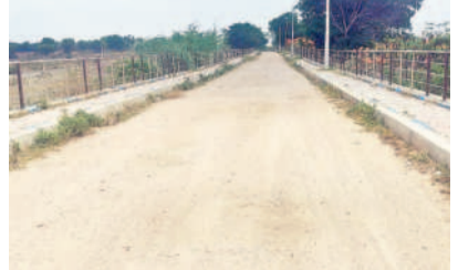
ప్రాజెక్టు వద్ద ఏర్పాటు చేసిన వాకింగ్ ట్రాక్

బీఆర్ఎస్ హయాంలో మారిస్తూ ప్రాజెక్టు రూపురేఖలు ఉమ్మడి రాష్ట్రంలో నిరాదరణ.. అభివృద్ధికి బడ్జెట్ లో నిధుల కేటాయింపు నీల