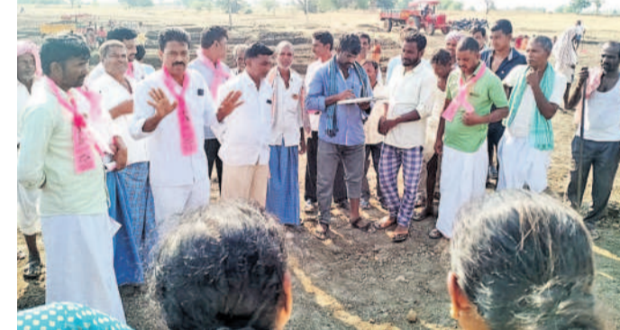
మర్నాడు లో ఉపాధి కార్యకర్తలను ఓటు అభ్యర్థిస్తున్న బీఆర్ఎస్ నాయకులు