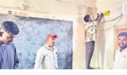
పోలింగ్ కు ఏర్పాట్లు