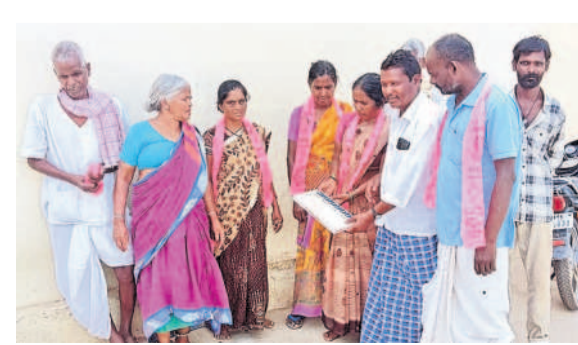
ధోమ : తిమ్మాపల్లిలో మహిళలకు ఓటు వేసి విధానాన్ని వివరిస్తున్న నాయకులు