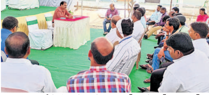
ఎన్నికల నిబంధనలను సూచించిన, సలహానిస్తున్న, వికారాబాద్ అదనపు కలెక్టర్ లింగానాయక్