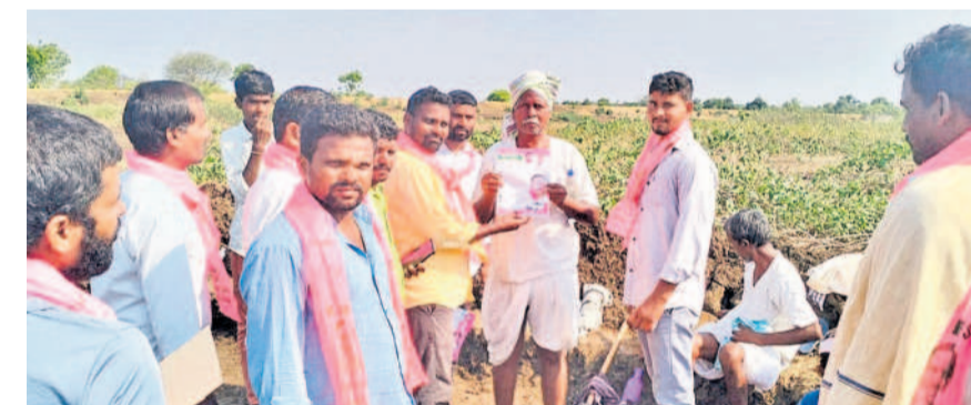
అల్లసాపేట గ్రామంలో ఉపాధి కార్యకర్తలను ఓటు వేయాలని కోరుతున్న ధారూరు మండల బీఆర్ఎస్ పార్టీ నాయకులు