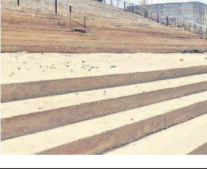
బతుకమ్మ నిమజ్జనం కోసం ఏర్పాటు చేసిన మెట్లు

ర్భంగా పరిగి పట్టణంపాటు మండలంలోని పలు గ్రామాల్లో ప్రతిష్టించే వినియోగ ప్రతిమలను నిమజ్జనం చేసేందుకు వీలుగా గణేశ్ మూర్తి నిర్మాణం, బతుకమ్మ పండుగ సందర్భంగా బతుకమ్మల నిమజ్జనానికి ప్రత్యేకంగా మెట్లను ఏర్పాటు చేశారు. ప్రాజెక్టులో బోటింగ్ ఏర్పాటుకు పర్యటన తీసుకున్నారు. జిల్లా ల్యాండ్ రిజిస్ట్రార్ నిర్మించారు. అలాగే ప్రాజెక్టులో పేరుకుపోయిన సిస్టమ్ తొలగించి నీటి నిలువ సామర్థ్యాన్ని పెంచారు. ప్రాజెక్టులో నీరు ఎక్కువ రోజులు ఉండేలా మిషన్ భగీరథ వృథా నీరు ఇందులోకి వచ్చేలా చూసి.. చేప పిల్లల పెంపకం ద్వారా మత్స్యకారులకు ఉపాధిలోపాటు రెండు పంటలకు సాగునీరు అందించాలన్నది గత బీఆర్ఎస్ ప్రభుత్వ ఆలోచన. ప్రస్తుతం లఖ్నాపూర్ ప్రాజెక్టులో నీరు వృథాగా తగ్గిపోయింది. భారీ పర్యటన కు సేవే ప్రాజెక్టులో నీరు వచ్చే అవకాశమున్నది. ఏది ఏమైనా లఖ్నాపూర్ ప్రాజెక్టు ఉమ్మడి రాష్ట్ర పాలనలో నిరాదరణకు గురికాగా.. బీఆర్ఎస్ హయాంలో రూపురేఖలు మారాయని స్పష్టంగా చెప్పాము.