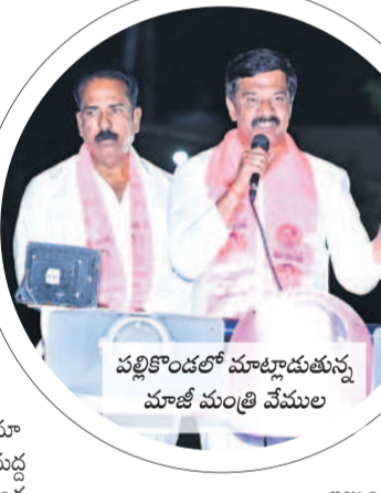
పల్లికొండలో మాట్లాడుతున్న మాజీ మంత్రి వేముల