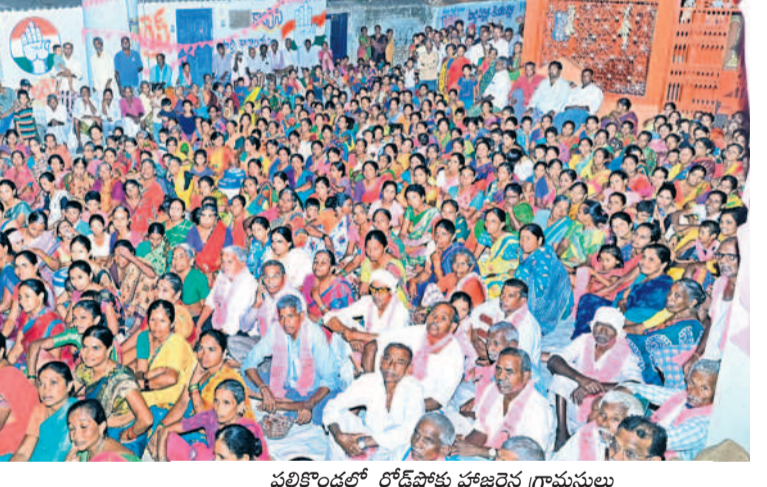
పల్లికొండలో రోడ్ షోకు హాజరైన గ్రామస్థులు

నీటి ఇబ్బందులు ఏర్పడడంలో మార్పు వచ్చిందని తెలిపారు. కాంగ్రెస్ అధికారంలోకి వచ్చి 150 రోజులు దాటితూ హామీలు, యువకులు, రైతులకు ఇచ్చిన హామీలు మాత్రం అమలుకావడంలేదన్నారు. సీసీ రేవంత్ రెడ్డి దేవుడి మీద ఒట్టతో ప్రజలను మద్దతుపెట్టడం రోజులు గడుపుతున్నారని