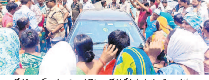
రోడ్డుపై ధాక్టర్ వాహనాన్ని అడ్డుకొని ఆందోళన చేస్తున్న మృతురాలి బంధువులు