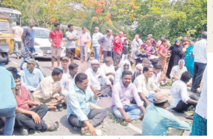
పాల్వంచలో ధర్నా చేస్తున్న రైతులు, బీజేపీని నాయకులు

బీజేపీ/మామిడి, మే 10: ప్రభుత్వం సకాలంలో వడ్ల కొనుగోలు చేయడం తమను ఆగం చేస్తున్నది రైతులు ఆవేదన వ్యక్తం చేశారు. పాల్వంచ తడిన తీవ్రంగా నష్టం పోతున్నామని, తడిన వడ్లను వెంటనే కొనుగోలు చేయాలని డిమాండ్ చేశారు. ఈ మేరకు