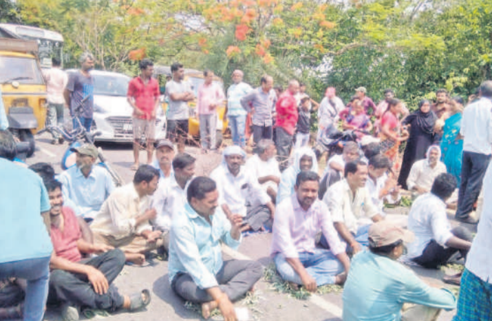
పాల్వంచలో ధర్నా చేస్తున్న రైతులు, బీఆర్ఎస్ నాయకులు

బీబీపీఠ్/మాచారెడ్డి, మే 10: ప్రభుత్వం సకాలంలో పట్టు కొనుగోలు చేయకుండా తమను ఆగం చేస్తున్నదని రైతులు ఆవేదన వ్యక్తం చేశారు. పర్లాంతో ధాన్యం తడిసి తీవ్రంగా నష్టం పోతున్నామని, తడిసిన పట్టణం వెంటనే కొనుగోలు చేయాలని డిమాండ్ చేశారు. ఈ మేరకు