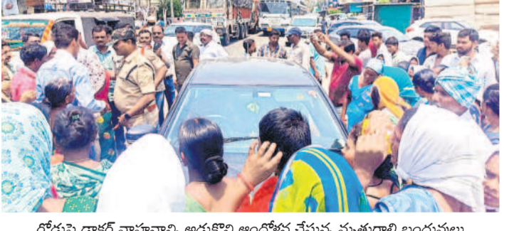
రోడ్డుపై ధాక్టర్ వాహనాన్ని అడ్డుకొని ఆందోళన చేస్తున్న మృతురాలి బంధువులు