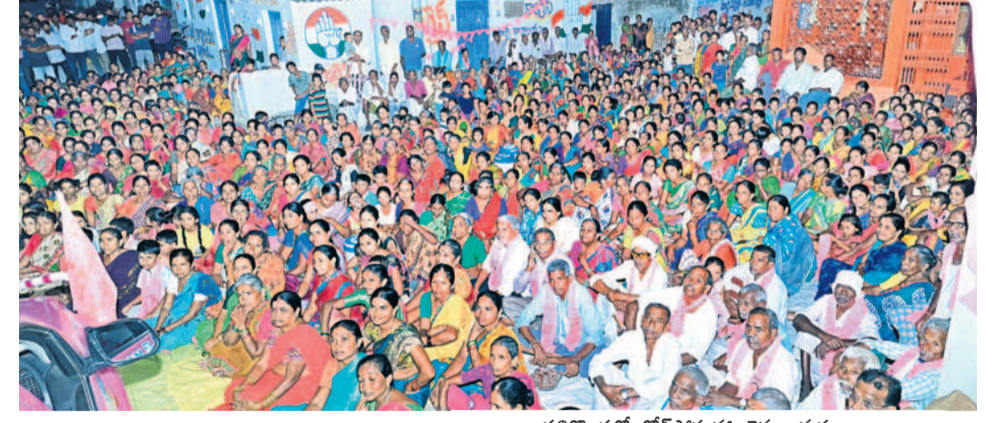
పల్లికొండలో లోడ్ షోకు హాజరైన గ్రామస్థులు