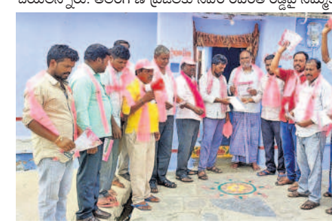
యాలాల మండలం బిన్నూరు గ్రామంలో..