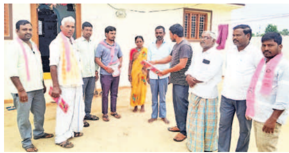
దోమ మండలంలోని దానాపూర్ లో