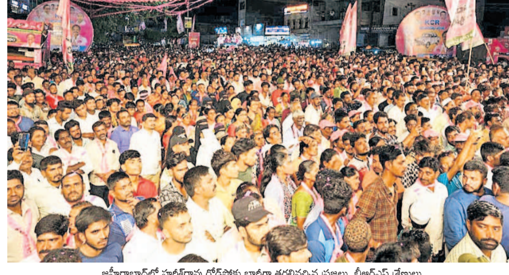
జమ్మిరాబాద్లో హరికేరావు రోడ్ షోకు భారీగా తరలివచ్చిన ప్రజలు, బీఆర్ఎస్ శ్రేణులు