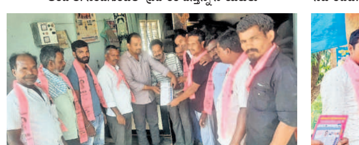
పాత్తూరు: సివెల్ నగర్లో బీఆర్ఎస్ నేతల ఎన్నికల ప్రచారం