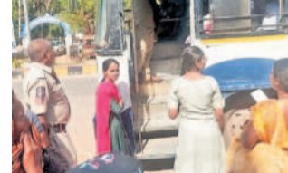
ప్రయాణికులు తనిఖీ చేస్తున్న పోలీసులు

అండోల్, మే 9: జోగిపేట బస్స్టాప్, బస్సుల్లో జేబుదొంగలు చేతివాలం ప్రదర్శిస్తున్నారు. జనం రద్దీగా ఉన్న బస్సులనే లక్ష్యంగా చేసుకుంటున్న దొంగలు బంగారు నగలు, నగలు, మొబైల్ ఫోన్లు చోరీ చేస్తున్నారు. గురువారం జోగిపేట నుంచి పల్నె పల్లి వెళ్తున్న ఆర్టీసీ బస్సు బస్స్టాప్లోకి వచ్చి రాగానే వెళ్లి సంఖ్యలో ప్రయాణికులు బస్సు ఎక్కోదుకు గురయ్యారు. ఇది అదునుగా నాచిందిన గర్భిణీ అనుభవించి బస్సును ఇదరు మహిళల దగ్గర ఫోన్స్ చోరీ చేశారు. గుర్తించిన బాధితులు వెంటనే జోగిపేట పోలీసులకు సమాచారం ఇవ్వడంతో వారు అక్కడికి చేరుకున్నారు. బస్సుల్లో అందరి వద్ద తనిఖీలు చేశారు. అయినా ఎవరి వద్ద ఫోన్స్ లభించలేదు. అక్కడే ఉబిత ప్రయాణం ప్రారంభమైస్తున్న సందర్భాల్లో తమకు రక్షణ లేకుండా పోయిందని పలువురు మహిళలు ఆరోపించారు. కిక్కిరిసిన బస్సుల్లో తలచు దొంగతనాలు జరుగుతూ వేలమందిన వస్తువులు పోగొట్టుకోవాల్సి వస్తుంది అనేవదన వ్యక్తం చేశారు.