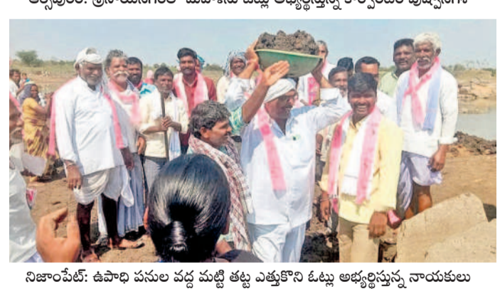
నిజాంపేట్: శివార్ల పనుల వద్ద మట్టి తట్టే అభ్యర్థిస్తున్న నాయకులు