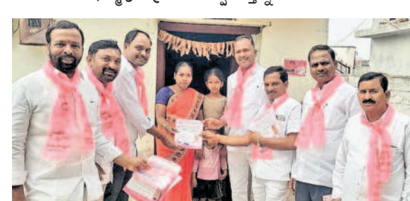
గుమ్మడిదల: బోంకపల్లిలో ఇంటింటి ప్రచారం