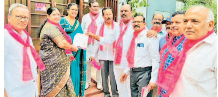
అర్బంపూరు: శ్రీమాయి నగర్లో మహిళల ఓట్లు అభ్యర్థిస్తున్న కార్యకర్త పుష్యానగర్