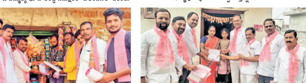
న్యాలకల్: మల్లేట్ ప్రచారం చేస్తున్న బీఆర్ఎస్ నాయకులు