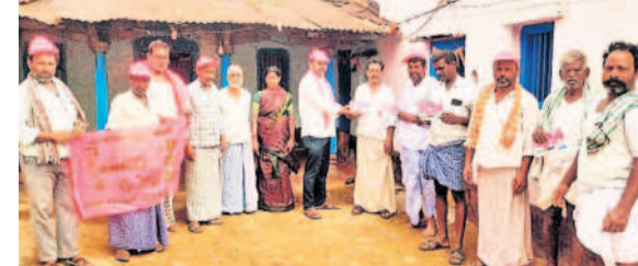
రాయకోడ: ధర్మాపూర్ ప్రచారం నిర్వహిస్తున్న బీఆర్ఎస్ నాయకులు