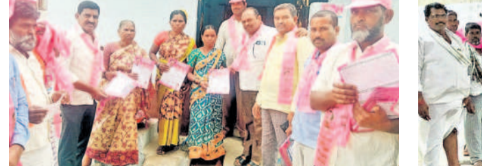
అండోల్: నేరడగంటలో ప్రచారం చేస్తున్న నాయకులు