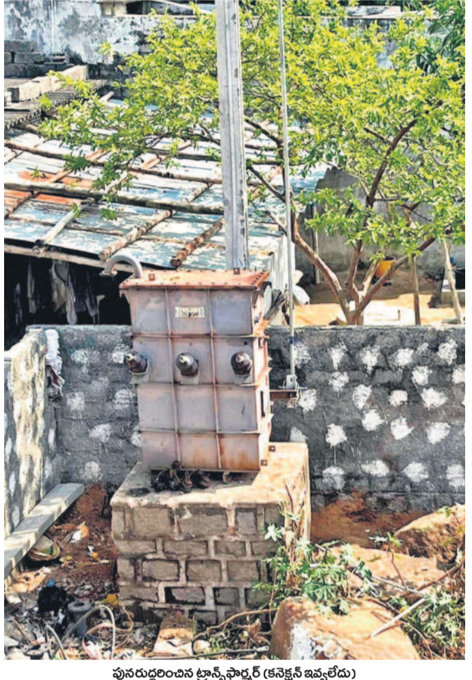
పునరుద్ధరించిన ట్రాన్స్ ఫార్మర్ (కనెక్ట్ కనెక్ట్)