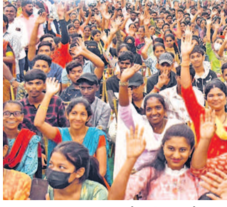
కంటోన్మెంట్ యువ సమైక్యత సందర్భంగా మద్దతు తెలుపుతున్న యువతీయవకులు