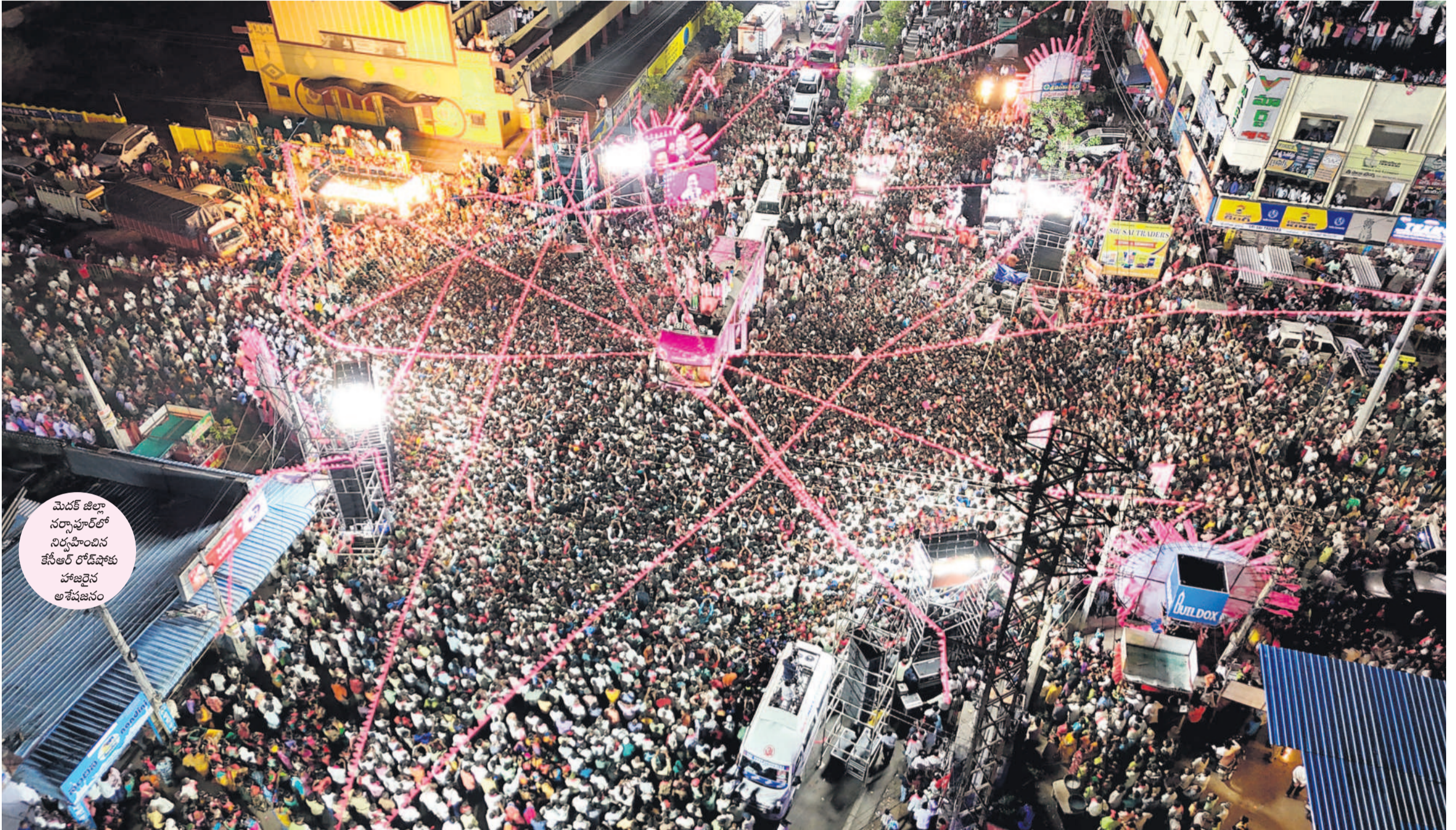
మెడక్ జిల్లా సర్కారులో నిర్వహించిన కేసీఆర్ రోడ్ షోకు హాజరైన అశోకజనం