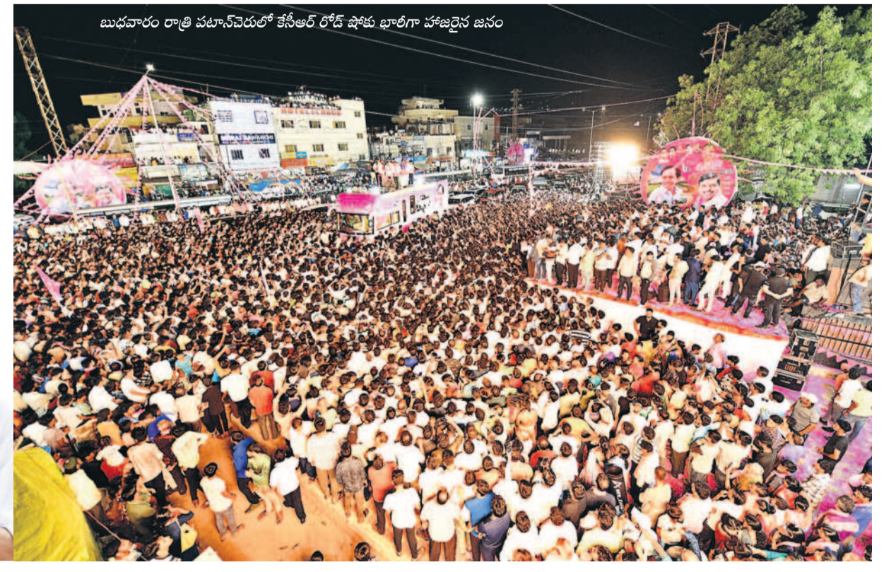
బుధవారం రాత్రి పటాన్చెరులో కేసీఆర్ రోడ్ షోకు భారీగా హాజరైన జనం

సంగారెడ్డి మే 8 (నమస్తే తెలంగాణ) : రేవంత్ రెడ్డి సర్కారు వల్లే పటాన్చెరు ప్రాంతంలో రియల్ ఎస్టేట్ కుప్పకూలింది, పరిశ్రమలు తరలిపోతున్నాయని బీఆర్ఎస్ అధినేత కేసీఆర్ అన్నారు. బుధవారం రాత్రి పటాన్చెరులో కేసీఆర్ రోడ్ షో చేపట్టారు. బుధవారం నిధులు పంపించామన్నారు. గిరిజనులకు 10 శాతం రిజర్వేషన్లు పెట్టామని చెప్పారు. పోడు భూములిచ్చామని... ఆ భూములకు రైతుబంధు ఇచ్చామన్నారు. కానీ, ఈ కాంగ్రెస్ ప్రభుత్వంలో పోడు భూములకు రైతుబంధు రాలేదన్నారు. సమాజంలో ఏ ఒక్క వర్గం గురించి కాంగ్రెస్ ప్రభుత్వం ఆలోచన చేయడం లేదన్నారు. బీఆర్ఎస్ ఎంపీలు గెలిస్తే డిల్లీలో మన హక్కుల గురించి పోరాడుతారన్నారు. తెలంగాణ మొత్తంలో అతి ఎక్కువ మెజార్టీ మీ అందరి దీవెనతో మెడక్ ఎంపీగా వెంకట్రామిరెడ్డి గెలుస్తున్నాడని కేసీఆర్ అన్నారు. సర్కారు నియోజకవర్గం నుంచి కనీసం 40 నుంచి 50 వేల మెజార్టీ ఇవ్వాలని కోరారు. సర్కారులో బీఆర్ఎస్ అధినేత కేసీఆర్ రోడ్ షో గ్రాండ్ సక్సెస్ అయ్యింది. పట్టణం గులాబీమయంగా మారింది. భారీగా జనం తరలివచ్చారు.