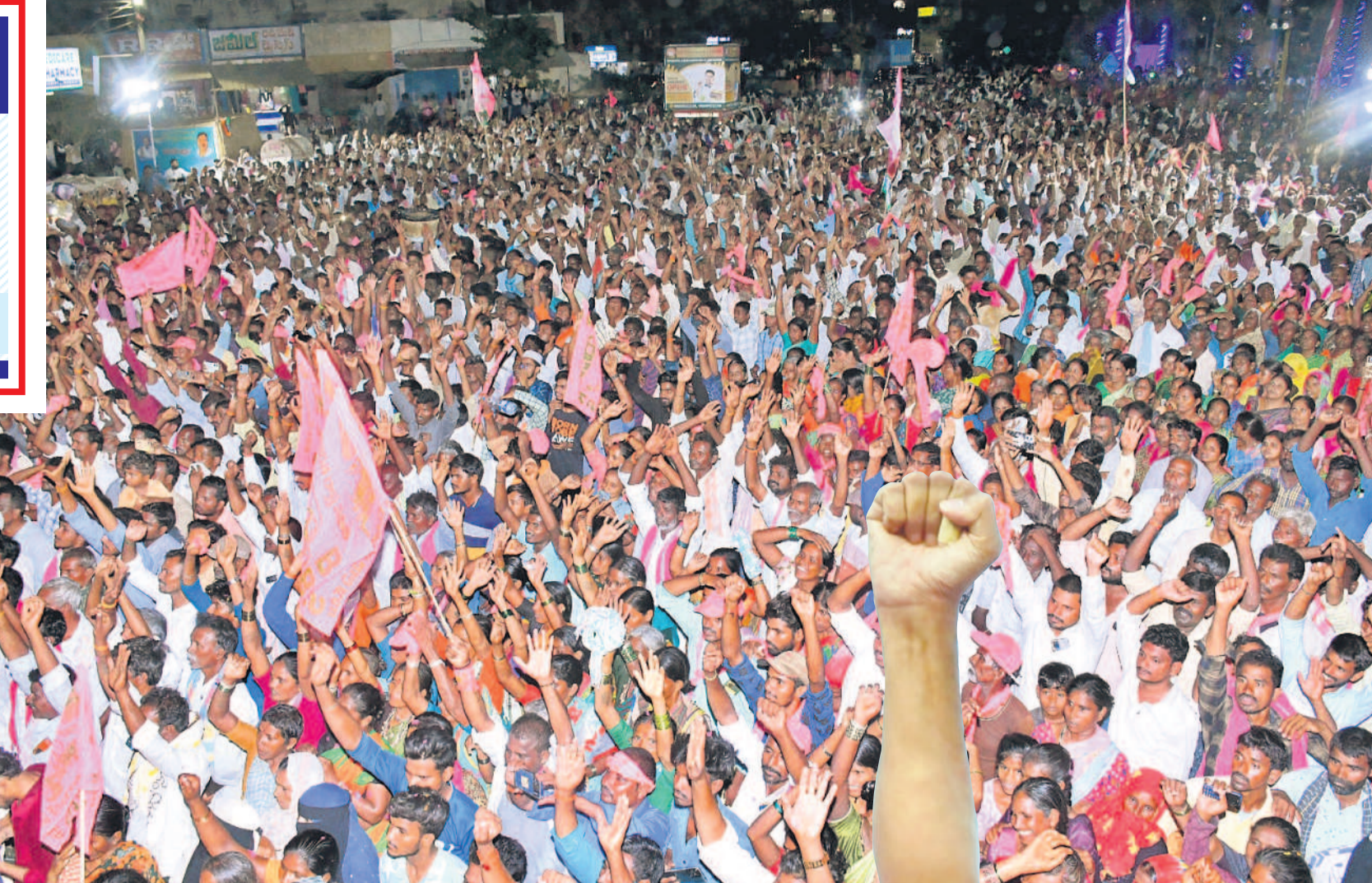
గద్వాల రోడ్ షోలకు అశేషంగా తరలివచ్చిన బీఆర్ఎస్ నాయకులు, ప్రజలు, అభిమానులు