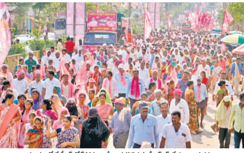
కల్యాణం కేటీఆర్ రోడ్ షోలకు నీరాజనం, కల్యాణం కేటీఆర్