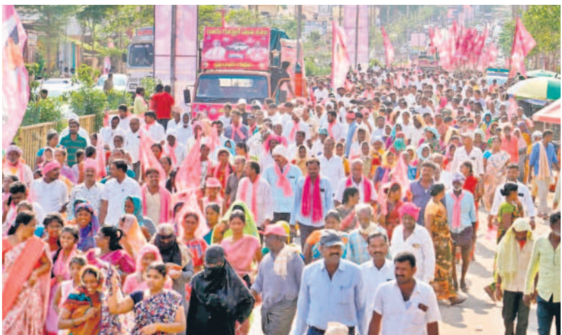
కల్యాణ్ కర్మి కేటీఆర్ రోడ్ షోలకు రాత్రిగా తరలివెళ్లిన బీఆర్ఎస్ నేతలు, కార్యకర్తలు