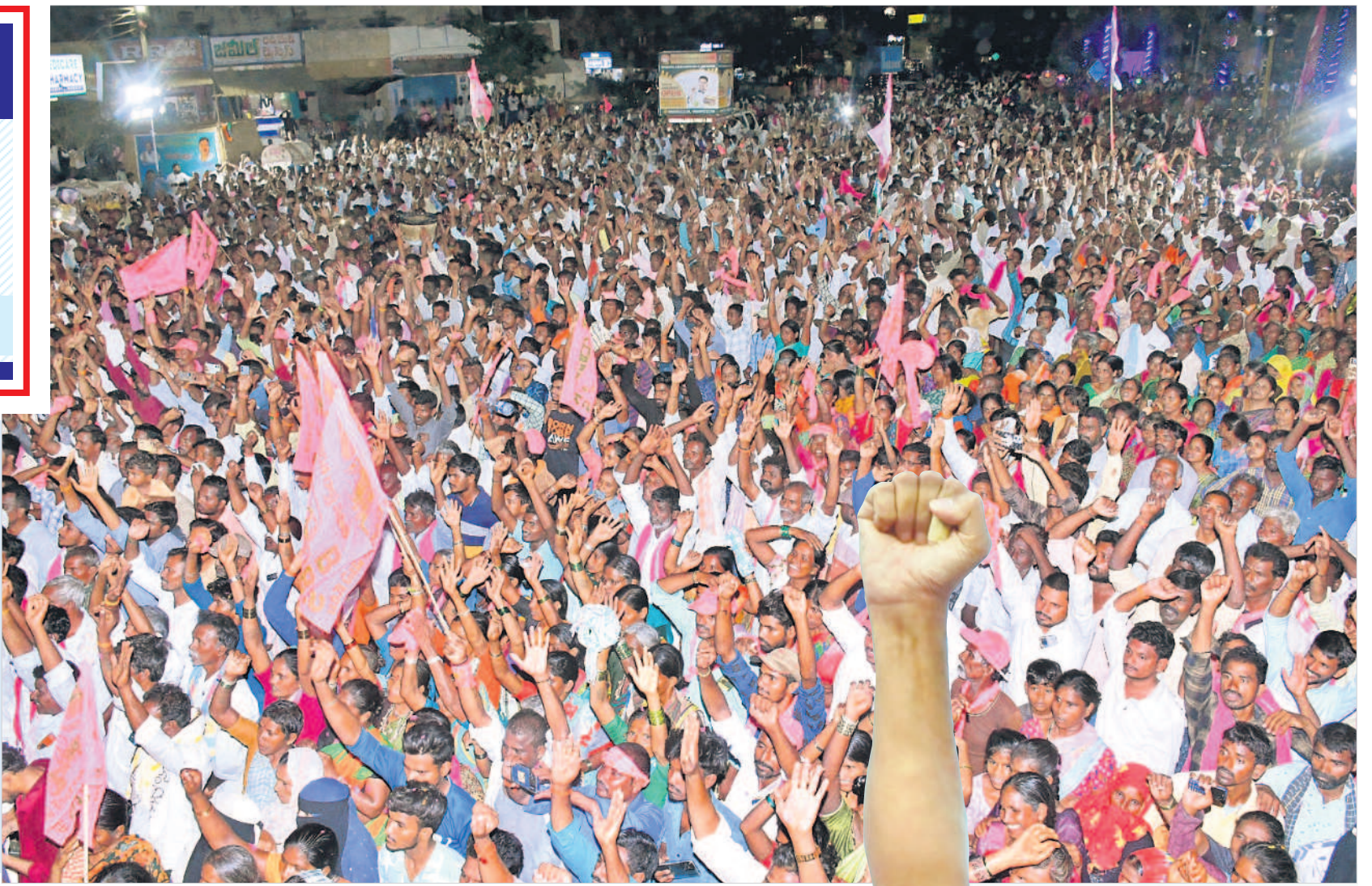
గద్వాల రోడ్ షోలకు అశేషంగా తరలివచ్చిన బీఆర్ఎస్ నాయకులు, ప్రజలు, అభిమానులు