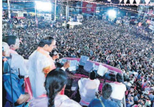
నర్సాపూర్లో మాట్లాడుతున్న గులాబీ బాస్ కేసీఆర్