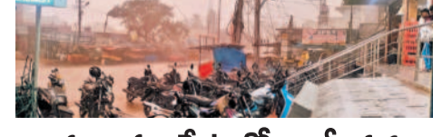
రామాయంపేటలో భారీ వర్షం