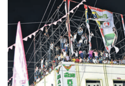
చౌరస్తా వద్ద భవనంపై ఉన్న హోర్నింగ్ పైకి ఎక్కిన ప్రజలు