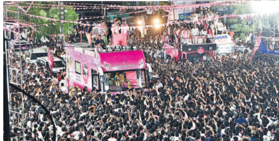
నర్సాపూర్లో నిర్వహించిన రోడ్ షోకు తరలివచ్చిన అశేష జనం