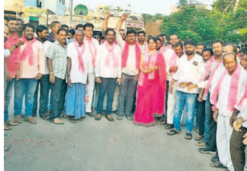
కేసీఆర్కు స్వాగతం పలుకుతున్న బీఆర్ఎస్ నాయకులు