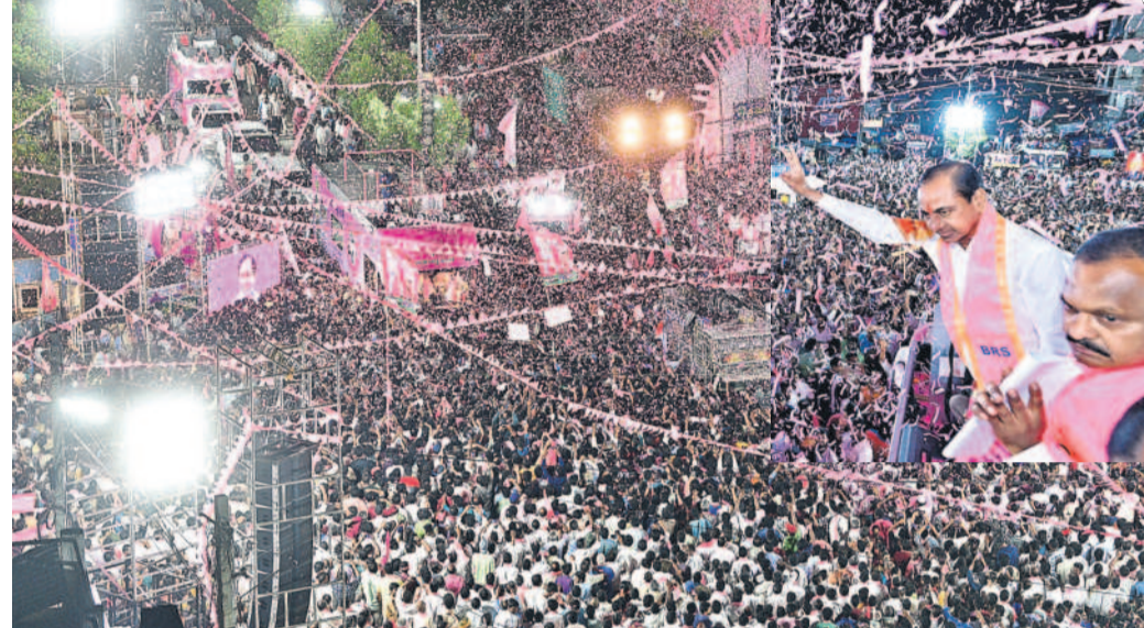
నర్సాపూర్లో జరిగిన రోడ్ షోలో ప్రజలకు అభివాదం చేస్తున్న కేసీఆర్