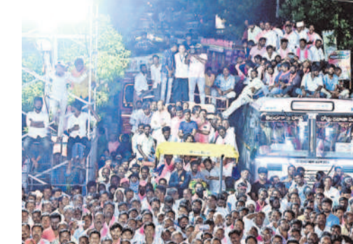
ఆర్డీసీ బస్సుపై కూర్చోని కేసీఆర్ ప్రసంగం వింటున్న ప్రజలు