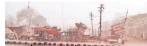
రామాయంపేటలో గాలి దుమారంతో కూడిన భారీ వర్షం

రామాయంపేట, మే 8: పట్టణంలో పొద్దుటా భూమిలో భగభగ లాఠీ జనం ఇబ్బందులు పడ్డారు. బుధవారం సాయంత్రం ఒక్కసారిగా గాలిదుమారంతో కూడిన భారీ వర్షం కురిసింది. దీంతో సుమారు గంట పాటు ఏకధాటిగా వర్షం కురువడంతో ఎక్కడి వాహనాలు ఆకర్షి నిలిచిపోయాయి. వాతావరణం చల్లబడింది.