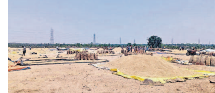
జిన్నారం మిసీ స్టేడియంలో వర్షానికి తడిసిన ధాన్యాన్ని ఆరబోస్తున్న రైతులు