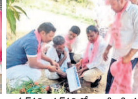
గుమ్మడిదల: వీరవగూడెంలో కరవత్రాలు పంచుతున్న నాయకులు