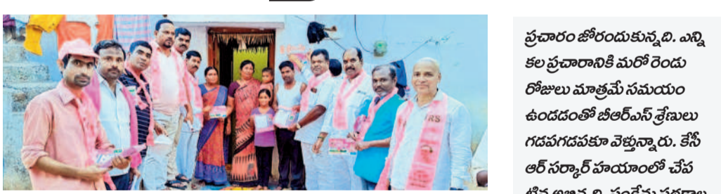
అందోల్: జోగిపేటలో ప్రచారం చేస్తున్న బీఆర్ఎస్ నాయకులు

ప్రచారం జోరందుకున్నది. ఎన్నికల ప్రచారానికి మరో రెండు రోజులు మాత్రమే సమయం ఉండడంతో బీఆర్ఎస్ శ్రేణులు గడవగడవకూ వెళ్తున్నారు. కేసీఆర్ సర్కార్ హయాంలో చేపట్టిన లభ్యపత్తి, సంక్షేమ పథకాల గురించి వివరాలు కారు గుర్తుకు ఓటియాలని బీఆర్ఎస్ అభ్యర్థులను గెలిపించాలని ఇంటింటికీ వెళ్లి ఓట్లను అభ్యర్థించారు.