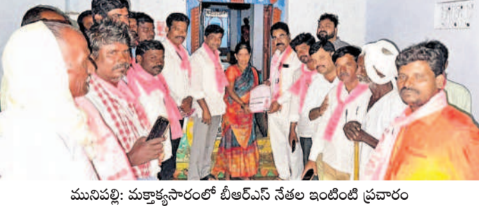
మునుపల్లి: మత్తాకూసారంలో బీఆర్ఎస్ నేతల ఇంటింటి ప్రచారం