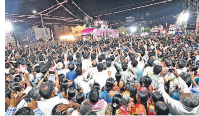
కేసీఆర్ రోడ్ షోకు భారీగా తరలివచ్చిన జనం