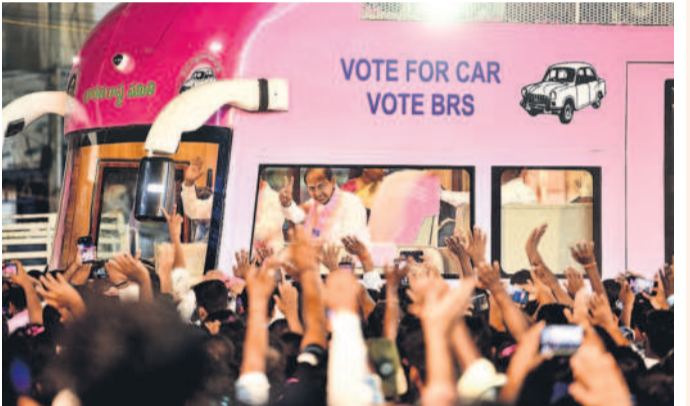
బస్సులో నుంచి ప్రజలకు విజయ సంతకం చూపుతున్న కేసీఆర్