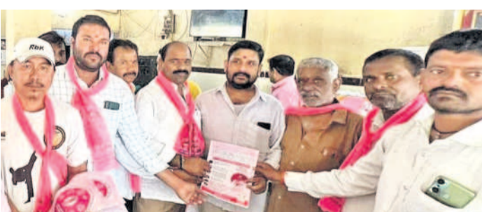
బొల్లారం: ఐడీపీ కాలనీలో బీఆర్ఎస్ నాయకుల ప్రచారం