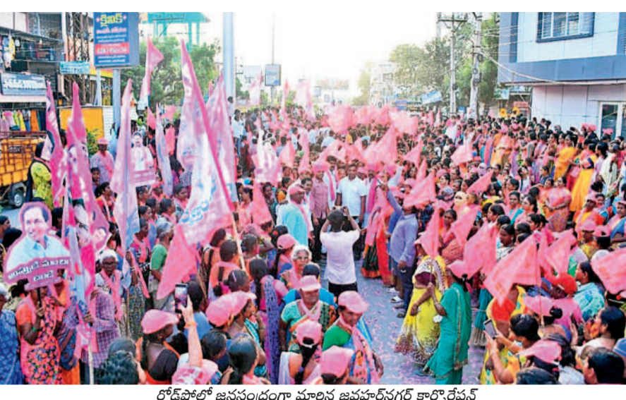
రోడ్ షోలో జనసంద్రంగా మాలిన జవహర్ నగర్ కార్పొరేషన్