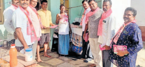
శామీరపేట మండలంలో ప్రచారం చేస్తున్న బీఆర్ఎస్ శ్రేణులు