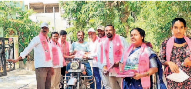
దమ్మాయిగూడలో ప్రచారం చేస్తున్న బీఆర్ఎస్ శ్రేణులు