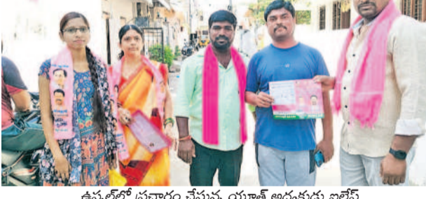
ఉప్పల్లో ప్రచారం చేస్తున్న యూత్ అధ్యక్షుడు బల్లె