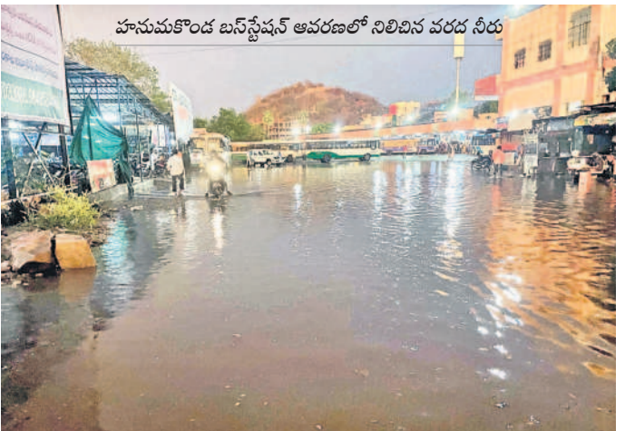
హనుమకొండ బస్ స్టేషన్ ఆవరణలో నిలిచిన వరద నీరు