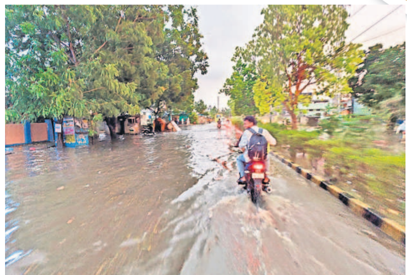
మడికొండలో జలమయమైన ప్రధాన రహదారి

నమస్తే నెట్ వర్క్, మే 7: ఉమ్మడి వరంగల్ జిల్లాను మంగళవారం ఈడురుగాలులు ఆగమోగం చేశాయి. ఉరుములు, మెరుపులతో వర్షం కురిసింది. జయశంకర్ భూపాలపల్లి, ములుగు, హనుమకొండ, వరంగల్, జనగామ జిల్లాల్లో గాలిదుమారం బీభత్సం సృష్టించింది. పలుచోట్ల చెట్లు కూలి, విద్యుత్ స్తంభాలు విరిగిపడ్డాయి. గజపేట, మహదేవపూర్, పలిమెల మండలాల్లోని కొనుగోలు కేంద్రాల్లో ధాన్యం తడిసి ముద్దయింది. ములుగు, ఏలూరునగరం, మంగలపేట, గోవిందరావుపేట, వెంకటాపూర్, వెంకటాపూర్ మండలాల్లో ధాన్యం రాపిడు తడిసి రైతులు ఇబ్బందులు పడ్డారు. బార్నాలిన్ షేడ్ల కిక్కి కాపాడుకునే ప్రయత్నం చేశారు. కమలాపూర్, బసవోలు, శామిపేట, ధర్మసాగర్, దామెర, కాజీపేట మండలాల్లో చెట్లు విరిగాయి. బాపూరు, అత్తకూరు, వెన్నారాపుపేట, వర్షపేట మండలాల్లో బలమైన ఈడురుగాలులు పలుచోట్ల ఇంటిపై కప్పలు ఎగిరిపడ్డాయి. గ్రేటర్ వరంగల్ లో సుమారు రెండు గంటల పాటు గాలి దుమారం బీభత్సం సృష్టించింది. దీంతో వాహనదారులు, బాటసారులు ఇబ్బందులు పడ్డారు. వర్షంతో హనుమకొండ బస్ స్టేషన్ జలమయం కాగా, పలు కాలనీల్లో వరద నీరు వచ్చి చేరింది. ఎన్నికల సేవద్దంలో ఏర్పాటు చేసిన ఫ్లెక్సీలు విరిగిపోగా, చెట్ల కొమ్మలు విరిగి పడ్డాయి. జనగామ, బప్పన్నపేట, నర్సేటి, తరిగిపూల, రఘునాథపల్లి, స్టేషన్