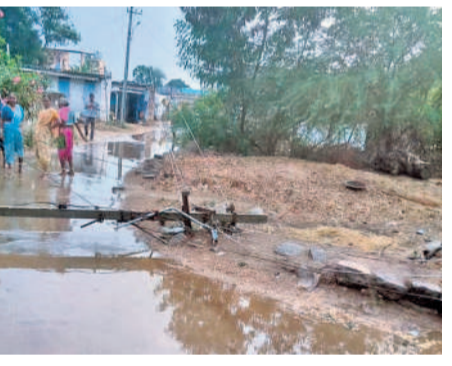
విన్నపెండూరులో కూలిన కరెంటు స్తంభం