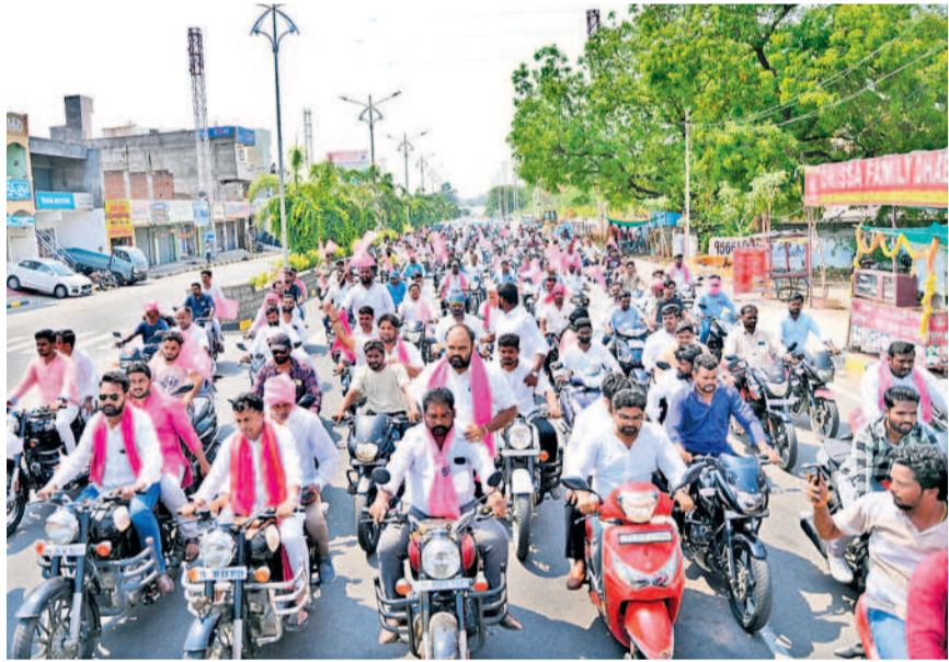
నల్లగొండలో బైక్ ర్యాలీ నిర్వహిస్తున్న బీఆర్ఎస్ నాయకులు, కార్యకర్తలు

వేసిన నోటిపెట్టె ఇచ్చి ఉద్యోగాలు ఇచ్చామనడం సిగ్గు చేటు. బీఆర్ఎస్ ఉద్యోగులకు మంచి పీఆర్ఎస్ ఇచ్చింది. కాంగ్రెస్ ఇచ్చిన హామీలు ఎందుకు అవ్వలేదు చెబుతుంది లేదు.