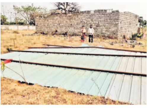
బుధరావుపేటలో గాలి దుమారానికి తేలిపడిన ఇంటి రేకులు