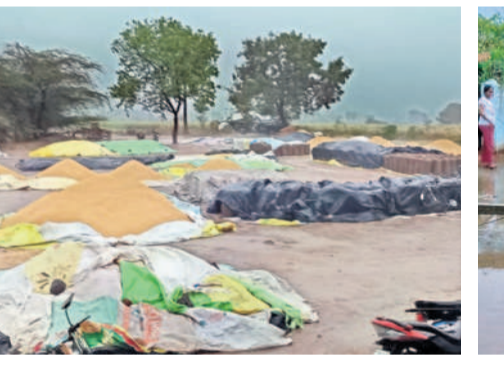
బసవోలు: కొండపల్లి కొనుగోలు కేంద్రంలో తడిచిన పరిధాన్యం