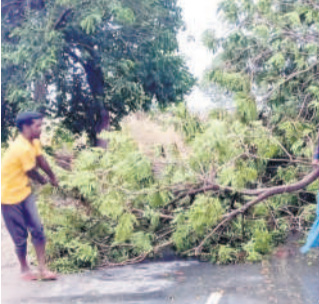
జైపూర్ : రోడ్డుకు అడ్డుగా వడ్డ చెట్టును తొలగిస్తున్న స్థానికులు