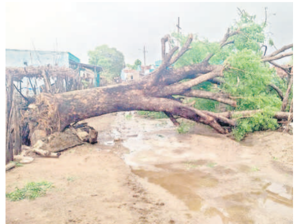
వేమనపల్లి : గాలివానకు విరిగి పడ్డ చెట్టు