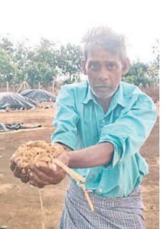
హాజీపూర్ : టీకెన వర్షంలో తడిసిన ధాన్యాన్ని చూపుతున్న రైతు