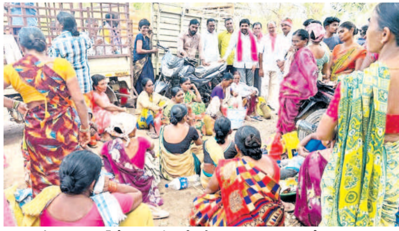
కాసిపేట : గురువారంలో ఉపాధి హామీ కార్యక్రమంలో ముఖ్యమంత్రి, మాజీ ఎమ్మెల్యే దుర్గం చిన్నయ్య