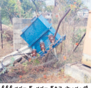
సీసీసీ నన్నూర్ : నన్నూర్ షెడ్యూల్ ప్రాంతంలో నేలకొరిగిన విద్యుత్ ట్రాన్స్మిషన్ టవర్