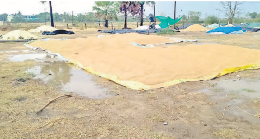
దహాగాం కోనుగోలు కేంద్రంలో అరబోసిన ధాన్యంలో నిలిచిన వర్షపు నీరు