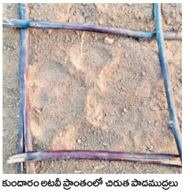
కుందారం అటవీ ప్రాంతంలో చిరుత పాదమర్దులు