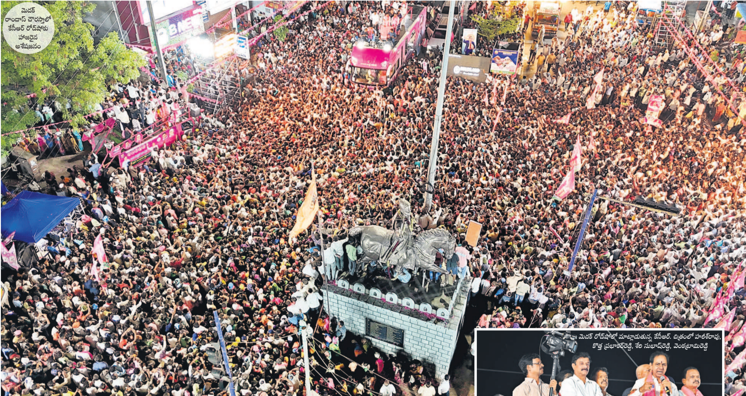
మెదక్ రాంధాస్ చౌరస్తాలో కేసీఆర్ రోడ్ షోలో హాజరైన అశేషజనం