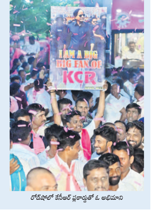
రోడ్ షోలో కేసీఆర్ ప్రకారంతో ఓ అభిమాని

'నేను హిందువును.. తెలంగాణ ప్రజలకు అత్త బంధువును. అందరం కలిసి బతకాలి. దాంట్లోనే గొప్పత్వం. దాంట్లోనే బలం ఉంటుంది. కానీ ప్రజలను విడదీసేలా మత విద్వేషాలు రెప్ప గొడితే లాభం ఉండదు. మీ ఎంపీ (అర్పిఎం) నోరు తెరిస్తే ఎట్లాంటి మాటలు ఉంటాయో.. ఎంత గండరగోళం ఉంటుందో తెలుసు'