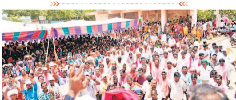
రోడ్ షోకు భారీగా హాజరైన బీఆర్ఎస్ నాయకులు, కార్యకర్తలు, ప్రజలు