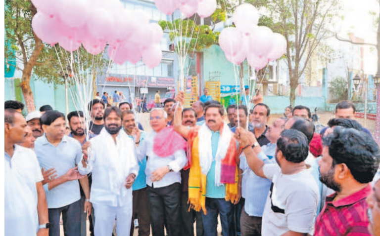
పింక్ కలర్ బెల్టాన్స్ ఎగరవేస్తున్న మాజీ మంత్రి శ్రీనివాస్ గౌడ్, ఎంపీ మన్నె