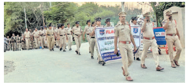
మేడ్చల్లో కవారు నిర్వహిస్తున్న పోలీసులు