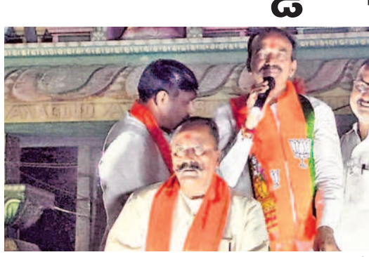
మేడ్చల్ రోడ్ షోల్లో మాట్లాడుతున్న బీజేపీ ఎంపీ అభ్యర్థి ఈటల రాజేందర్

నంద విగ్రహం వద్ద నిర్వహించిన కార్యక్రమంలో మాట్లాడారు. ఆడ బిడ్డలకు రూ.2500 ఇస్తూ, వికలాంగులకు రూ.8 వేల పింఛన్ ఇస్తూ, కల్యాణలక్ష్మి పథకం కింద రూ.లక్ష తులం బంగారం ఇస్తూ, రూ.2 వేల పింఛనను రూ.4 వేలు చేస్తామంటూ అసెంబ్లీ ఎన్నికల్లో హామీలు ఇచ్చాడన్నారు. కానీ అధికారంలో వచ్చి ఐదు నెలలు గడుస్తున్నా ఇచ్చిన హామీలను నెరవేర్చలేదని, రూ.2 లక్షల రైతు రుణం హామీ అయినా అని ప్రశ్నించారు. రేవంత్ రెడ్డి యువకుడు, ఉత్సాహవంతుడు అనుకున్నారని కానీ బుద్ధర్ ఖాన్ లా మాట్లాడుతున్నారని విమర్శించారు. ఇప్పుడు ఎంపీ ఎన్నికల్లో కాంగ్రెస్ ను గెలిపించి, రాహుల్ గాంధీని ప్రధాని చేయాలి అంటున్నాడన్నారు. కాంగ్రెస్ ని 40, 50 సీట్ల కన్నా ఎక్కువ రావని, రాహుల్ ప్రధాని అయ్యే దిద్దన్నారు. తనను ఎంపీగా గెలిపిస్తే నేరుగా ప్రధాని మోడి వద్దకు వెళ్లి అభివృద్ధి కోసం కృషి చేస్తానని హామీ ఇచ్చారు. మల్కాజ్ గిరిలో ప్రధాని పర్యటించిన సందర్భంగా గెలిచి రావాలి, ప్రజలు అడిగినవన్నీ నెరవేరుస్తానని హామీ ఇచ్చారని ఆయన చెప్పారు.