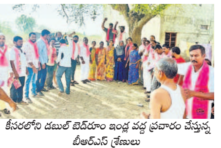
కీసరలోని డబుల్ టెడరం ఇండ్ల వద్ద ప్రచారం చేస్తున్న బీఆర్ఎస్ శ్రేణులు