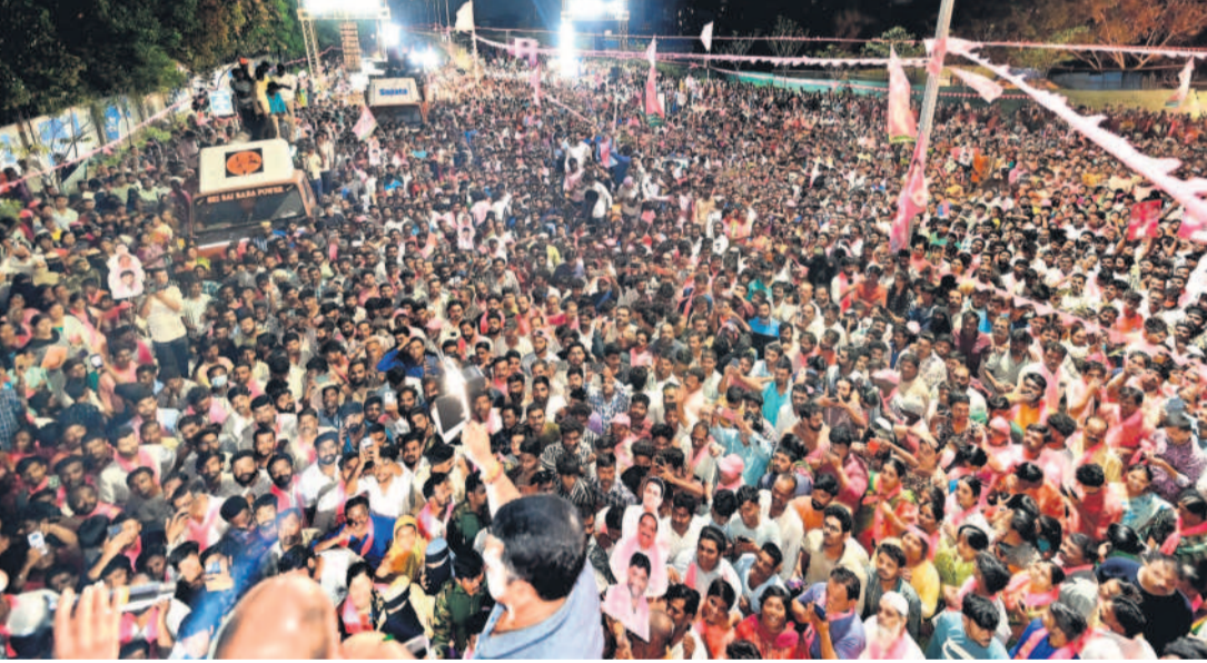
కొండాపూర్ అర్బన్ అఫీసు వద్ద కేటీఆర్ రోడ్ షోకు భారీగా హాజరైన జనం