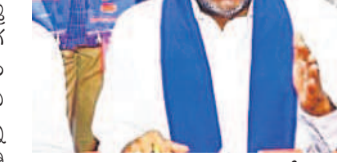
మాట్లాడుతున్న వంగపులి ఖిలవానీ

హైదరాబాద్, మే 6 (నవస్త్రే తెలంగాణ): ఆకాల వర్షాలతో పంట నష్టపోయిన రైతులకు ప్రభుత్వం పరిహారాన్ని విడుదల చేసింది.