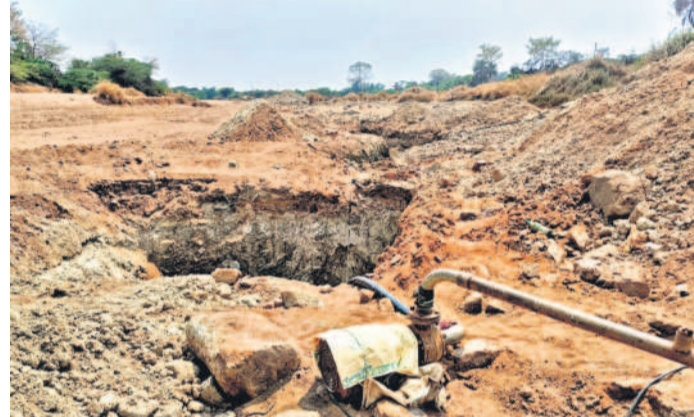
జయశంకర్ భూపాలపల్లి జిల్లాలోనే బిట్టల మండలం నవాబుపేట శివారు వలివారులో సాగునీరు అందక తప్పిన బావి

టీఎంసీలను ఎత్తిపోసుకున్నా గోదావరి బేసిన్ లో పంటలు ఎండిపోయేవి కావు. గత సంవత్సరం, ఈ ఏడాది యాసంగి సమయంలో (జనవరిలో) గోదావరి బేసిన్ లోని ప్రాజెక్టుల్లో నీటి నిల్వలు దాదాపుగా సమానంగానే ఉన్నాయి. కేవలం ఆరు టీఎంసీల వరకు మాత్రమే తేడా ఉన్నది. కాళేశ్వరం నుంచి ఎత్తిపోసిన నీళ్లు తోడవడంతో చెరువులు నిండుగా ఉండి భూగర్భజలాలు ఎప్పుడొకప్పుడు రిచార్జ్ అయ్యాయి. ఇప్పుడు ఆ కాళేశ్వరం నుంచి వచ్చే నీళ్లు లోటుగా మారడంతోనే కరువు ఛాయలు అలుముకున్నాయి. ఇందుకు ఎస్సార్‌సీస్ ఆయకట్టే ఒక ఉదాహరణ. ఎస్సార్‌సీస్, మిడ్‌మానేరు, ఎల్‌ఎండి, ఎల్లంపల్లిలో అందుబాటులో ఉన్న నీటి నిల్వల్లో తాగునీటి అవసరాలను అంచనా వేసి, మిగతా నీటిని యాసంగి సాగునీటి అవసరాలకు కేటాయించడం అవసరమిది. ఈ ఏడాది వైతం ఎస్సార్‌సీస్ స్టేజ్-1 కింద 9,85,013 ఎకరాలు ఉండగా, 8,28,297 ఎకరాలకు (3.87 లక్షల ఎకరాలకు అరుతడి పంటలకు, 4.41 లక్షల ఎకరాలకు తరి పంటలకు) సాగు