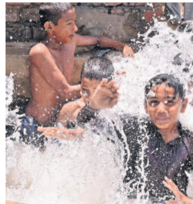
సోమవారం ఎండ తీవ్రతను తట్టుకోలేక హైదరాబాద్‌లో జలకాలాలాడుతున్న చిన్నారులు

రాష్ట్రంలో సోమవారం కూడా రికార్డు ఉష్ణోగ్రతలు నమోదయ్యాయి. వివిధ ప్రాంతాల్లో 46 డిగ్రీలకు పైగా ఉష్ణోగ్రతలు నమోదైనట్లు వాతావరణ శాఖ తెలిపింది. జగిత్యాల జిల్లా గుల్లకోట, తిలీపూర్‌లో 46.8 డిగ్రీలు, పెద్దపల్లి జిల్లా ముత్తూరులో 46.4, నూగంపల్లి, జగిత్యాల జిల్లా కోల్వూరులో 46.3, కరీంనగర్ జిల్లా జమ్మికుంటలో 46.2, జగిత్యాల జిల్లా గోదారులో 46.1, కుమ్రంబిం జిల్లా తిర్యాలి, మంచిర్యాల జిల్లా ననిపూర్‌లో 46, వెల్లూరులో 45.9 డిగ్రీల వ్యాసం గరిష్ట ఉష్ణోగ్రతలు నమోదైనట్లు పేర్కొన్నది. సుంద్ర మోస్తరు వర్షాలు కురిసే అవకాశం ఉన్నదని హైదరాబాద్ వాతావరణ కేంద్రం తెలిపింది.