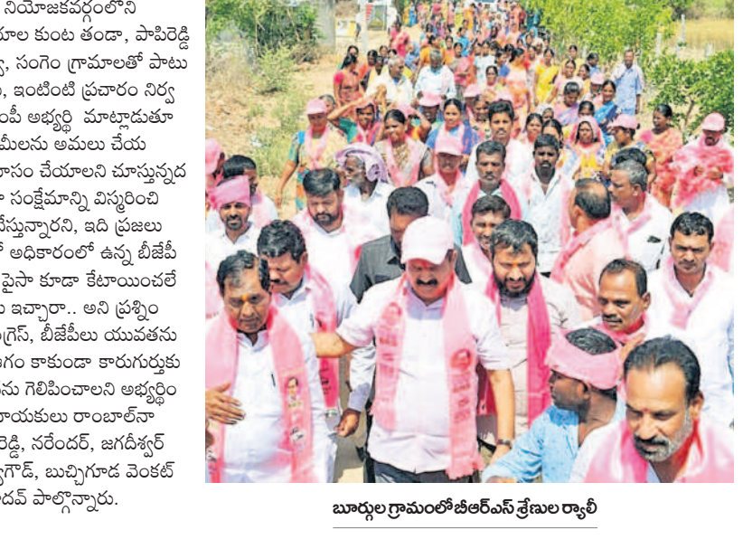
బూర్గుల గ్రామంలో బీఆర్ఎస్ వేణు రాల్చి