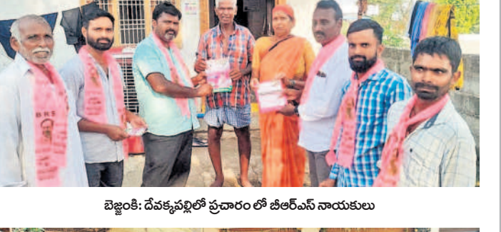
జిల్లంకి: దేవకపల్లిలో ప్రచారం లో బీఆర్ఎస్ నాయకులు