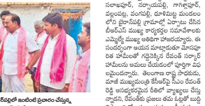
కొబాడ: ధర్మసాగర్ లో ఇంటింటా ప్రచారం చేస్తున్న బీఆర్ఎస్ నేతలు