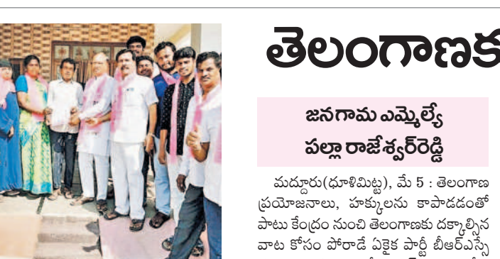
సిద్దిపేట: 5వ వాద్దలో ప్రచారం చేస్తున్న కార్మిల్ల వివోడి తదితరులు