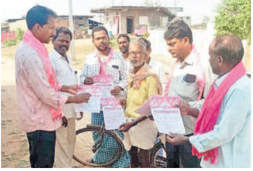
మద్దూరు (ధూళిమట్టు): రింగాఫూర్లో వృద్ధుడిని ఓటు అడుగుతున్న బీఆర్ఎస్ నాయకులు