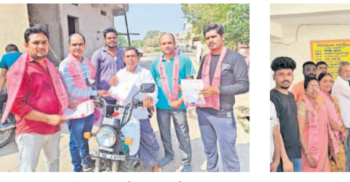
సిద్దిపేట: పట్టణంలోని 15 వాద్దలో ఇంటింటా ప్రచారం చేస్తున్న బీఆర్ఎస్ శ్రేణులు