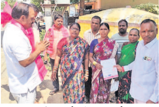
మిరుద్దాపేట: అల్లాలలో ఇంటింటా ప్రచారం చేస్తున్న బీఆర్ఎస్ శ్రేణులు