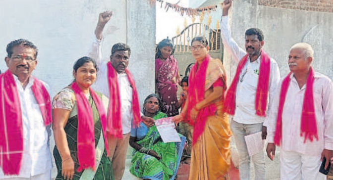
చేర్యాలలో బీఆర్ఎస్ నాయకుల విప్లవ ప్రచారం