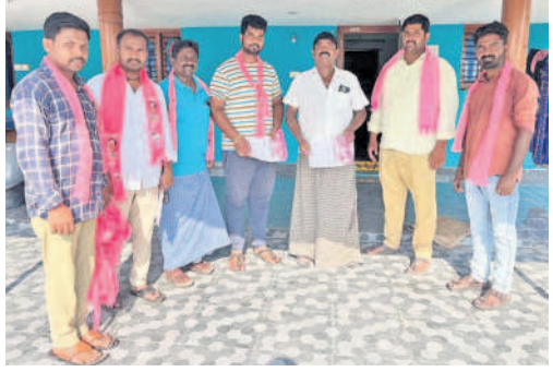
కొమురవెల్లి: గురువనపేటలో ప్రచారం చేస్తున్న బీఆర్ఎస్ నాయకులు