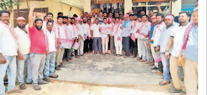
ములుగు: ప్రచారంలో డిఎన్ఎ డైరెక్టర్ జట్టు లంజెరెడ్డి