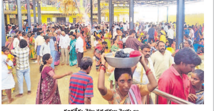
గంగరేగు చెట్టు వద్ద భక్తుల మొక్కులు