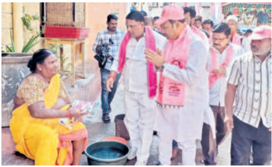
ఇందూరులోని 44వ డివిజన్లో ప్రచారం చేస్తున్న బిగాల

-రాజీవ్ గాంధీ హాస్పిటం, కలెక్టర్, జిల్లా ఎన్నికల అధికారి