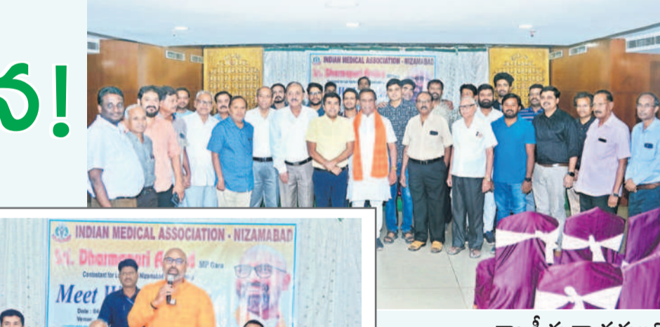
మాట్లాడుతున్న బీజేపీ ఎంపీ అర్బన్ అర్బన్

రాజకీయ నాయకులతో ప్రభుత్వ ఉద్యోగుల భేటీ కోడ్ ఉల్లంఘన.. ఎన్నికల ప్రచారాన్ని నియమావళి అనుబంధం ఉన్నప్పటికీ పరిస్థితుల్లోనూ ప్రభుత్వ ఉద్యోగులెవరూ రాజకీయ నాయకులు నిర్వహించే కార్యక్రమంలో పాల్గొనరాదు. ఈ సీనియర్లను మేరకు అలాంటి వాటికి దూరంగా ఉండాలి. అలా పాల్గొంటే ఎన్నికల కోడ్ ఉల్లంఘన కిందికే వస్తుంది.